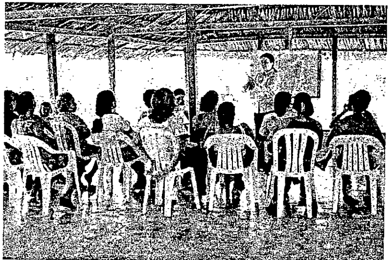
Presentació Proyecto Artesanos Cañaflecha