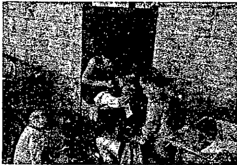
Taller Eurimia Avilés Rodríguez