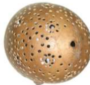
Proceso del calado, en apliance. San Antero. Abril 2006.