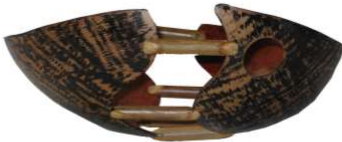
San Antero. Abril 2006.

Una vez seca la pintura aplicada, se procede a lijar la pieza en sentido contrario al de la textura, para poder dar el acabado final.