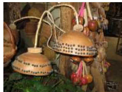
Proceso de decorado con semillas, lámpara. San Antero. Fotógrafo: Omar Darío Martínez G. Artesanías de Colombia. Abril 2006.

En la actualidad, se elaboran con el totumo y calabazo objetos como lámparas, servilleteros, copas, fruteros, entre otros.