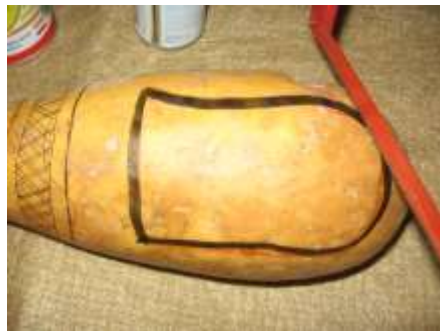
San Antero. Abril 2006.

Ya realizado el proceso de patronaje, se procede a calcar sobre el totumo y/o calabazo la pieza correspondiente, buscando, las partes mas homogéneas del fruto para la elaboración de la pieza.