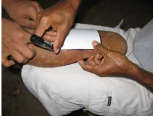
San Antero. Abril 2006.

Ya realizado el proceso de patronaje, se procede a calcar sobre el totumo y/o calabazo la pieza correspondiente, buscando, las partes mas homogéneas del fruto para la elaboración de la pieza.