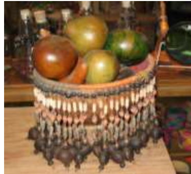
Proceso de decorado con semillas, en frutero. San Antero. Abril 2006.