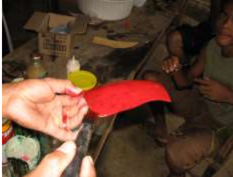
San Antero. Fotógrafo: Omar Darío Martínez G. Artesanías de Colombia. Abril 2006.

Luego se pinta cada pieza con laca, primero se aplica una base roja luego una base negra, se deja secar después de cada mano.