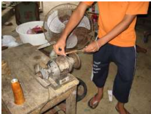
San Antero. Fotógrafo: Omar Darío Martínez G. Artesanías de Colombia. Abril 2006.

El siguiente paso, es cortar la figura realizada sobre el totumo y/o calabazo, se lo realiza con segueta.