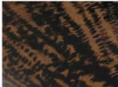
San Antero. Fotógrafo: Omar Darío Martínez G. Artesanías de Colombia. Abril 2006.

Luego se pinta cada pieza con laca, primero se aplica una base roja luego una base negra, se deja secar después de cada mano.