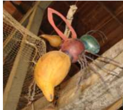
Proceso de pintura con vinilo, insecto. San Antero. Artesanías de Colombia. Abril 2006.