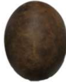
Proceso del San Antero. Fotógrafo: Omar Darío Martínez G. Artesanías de Colombia. Abril 2006.