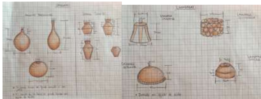
Líneas propuestas por la comunidad