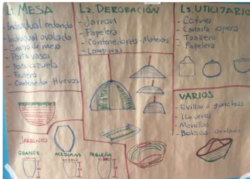
Actividad de Lluvia de Ideas