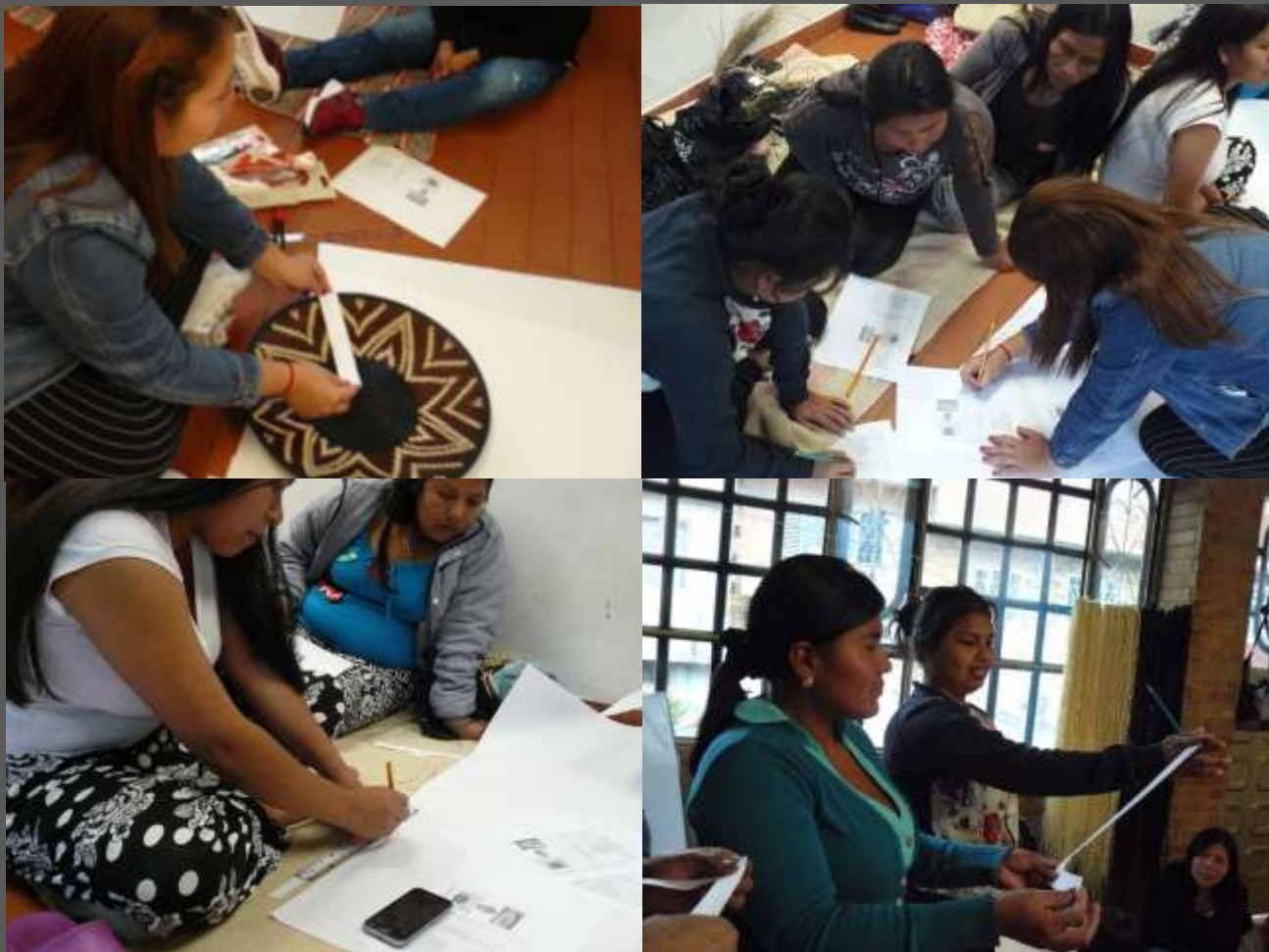
LUGAR: CIUDAD BOLIVAR, BOGOTÁ D.C

Estas guías en papel facilitan el proceso de producción teniendo en cuenta que no todas cuentan con metros y reglas y habitualmente teniendo estas herramientas no quedan con las medidas exactas, por lo cual la guía es mucho más exacta y la importancia de que ellas fueran las que la construyeran logra que en caso de pérdida puedan volver a elaborarla.