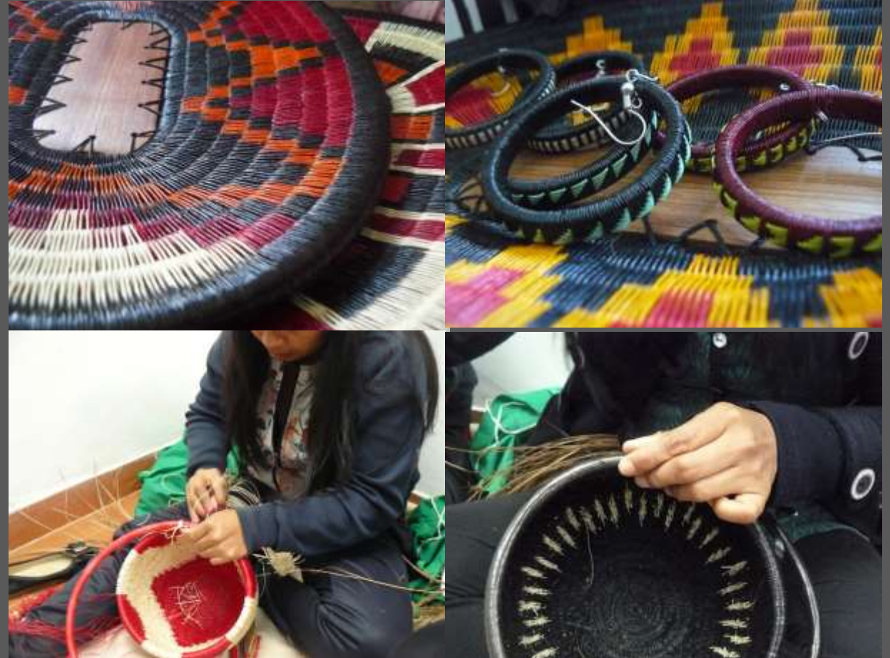
LUGAR: CIUDAD BOLIVAR, BOGOTÁ D.C