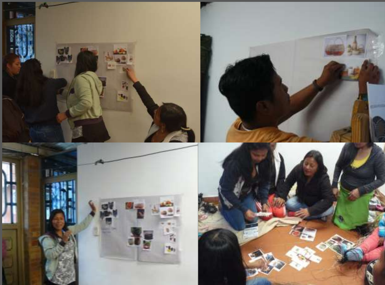
LUGAR: CIUDAD BOLIVAR, BOGOTÁ D.C

Se logro establecer que este taller brinda inspiración al grupo con productos que se pueden generar con base a productos similares, en donde se deja planteado que no se debe copiar el diseño de los referentes, si no ver como por medio de texturas, combinaciones, formas, se pueden crear nuevos diseños.