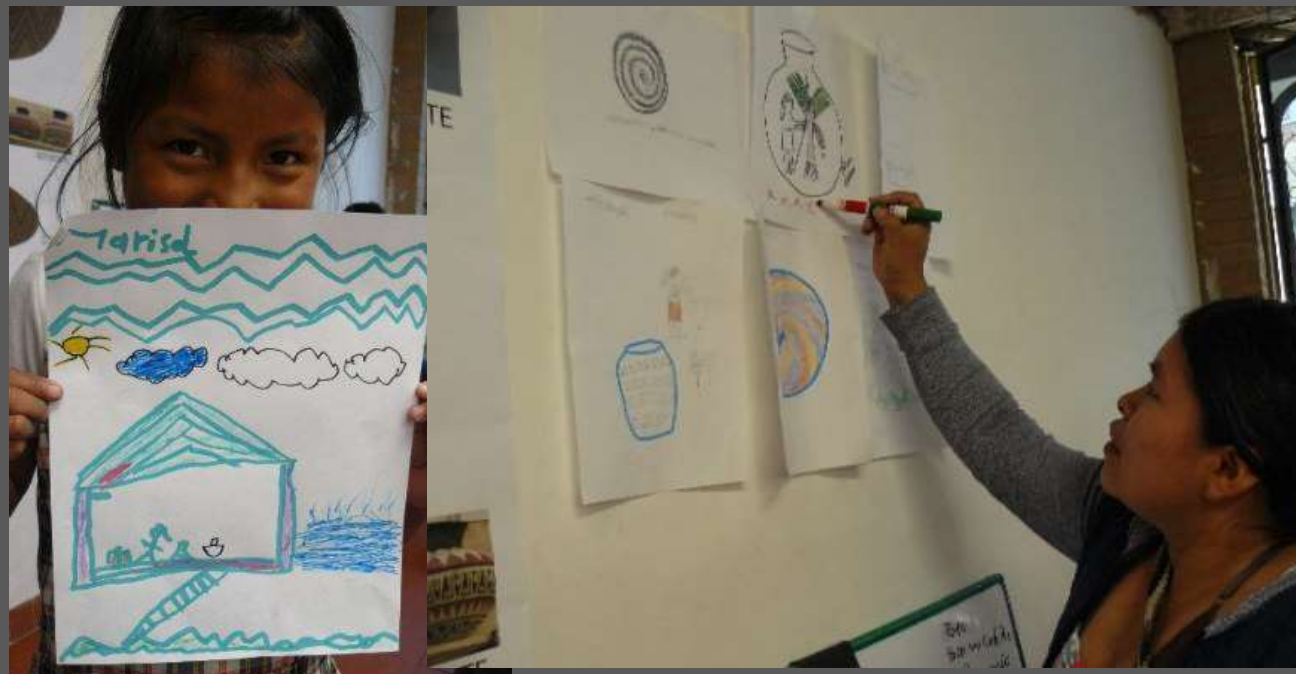
LUGAR: CIUDAD BOLIVAR, BOGOTÁ D.C

Poder generar reconocimiento de la comunidad en eventos comerciales los cuales incentiven la ventas de sus artesanías y que el logo sea diga de su etnia y el oficio que trabajan.