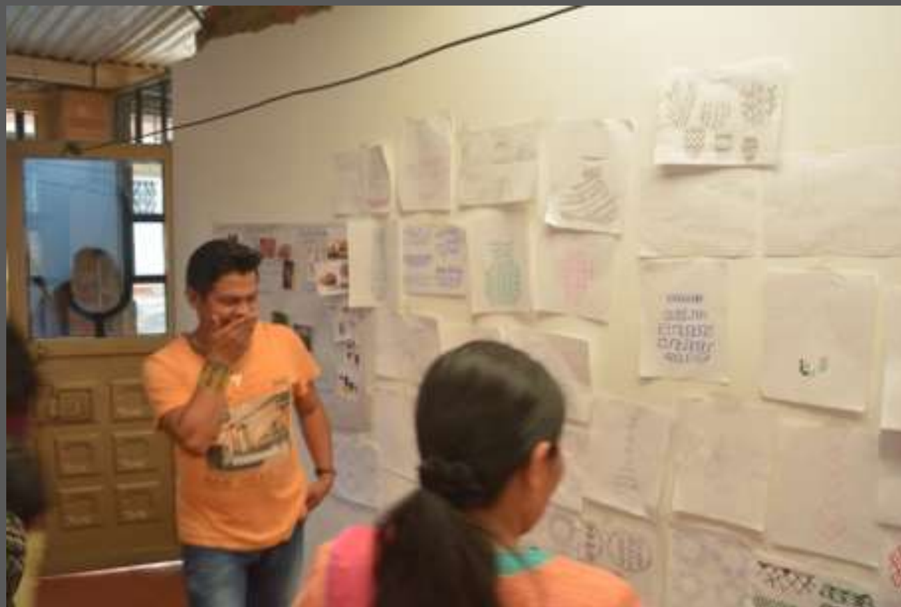
LUGAR: CIUDAD BOLIVAR, BOGOTÁ D.C

Se logro la realización de productos con base a este taller, el genera nuevas líneas de productos y en donde el grupo artesanal queda con la herramienta de como desarrollar diferentes propuestas de una manera autónoma.