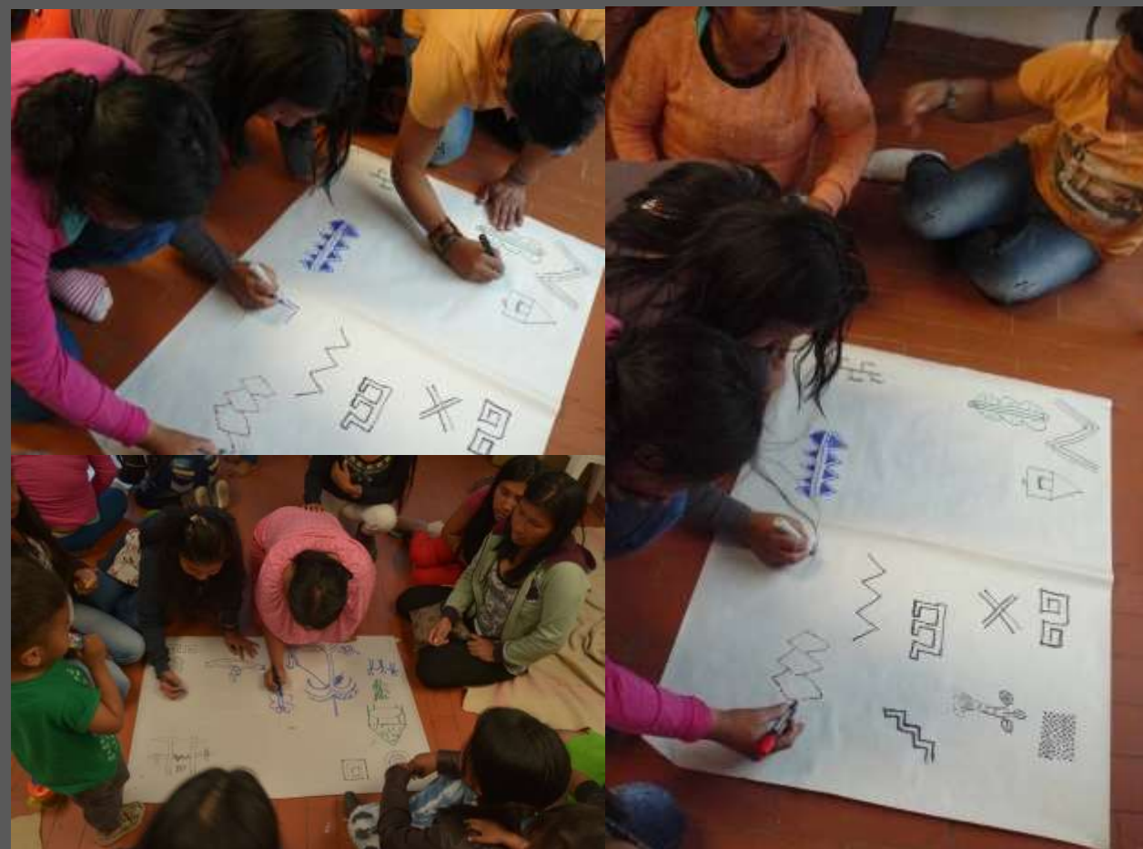
LUGAR: CIUDAD BOLIVAR, BOGOTÁ D.C

Con el levantamiento de la simbología tradicional de la etnia Wounaan se logra que la comunidad puedan incorporar en sus productos los símbolos de tal manera que generen identidad.