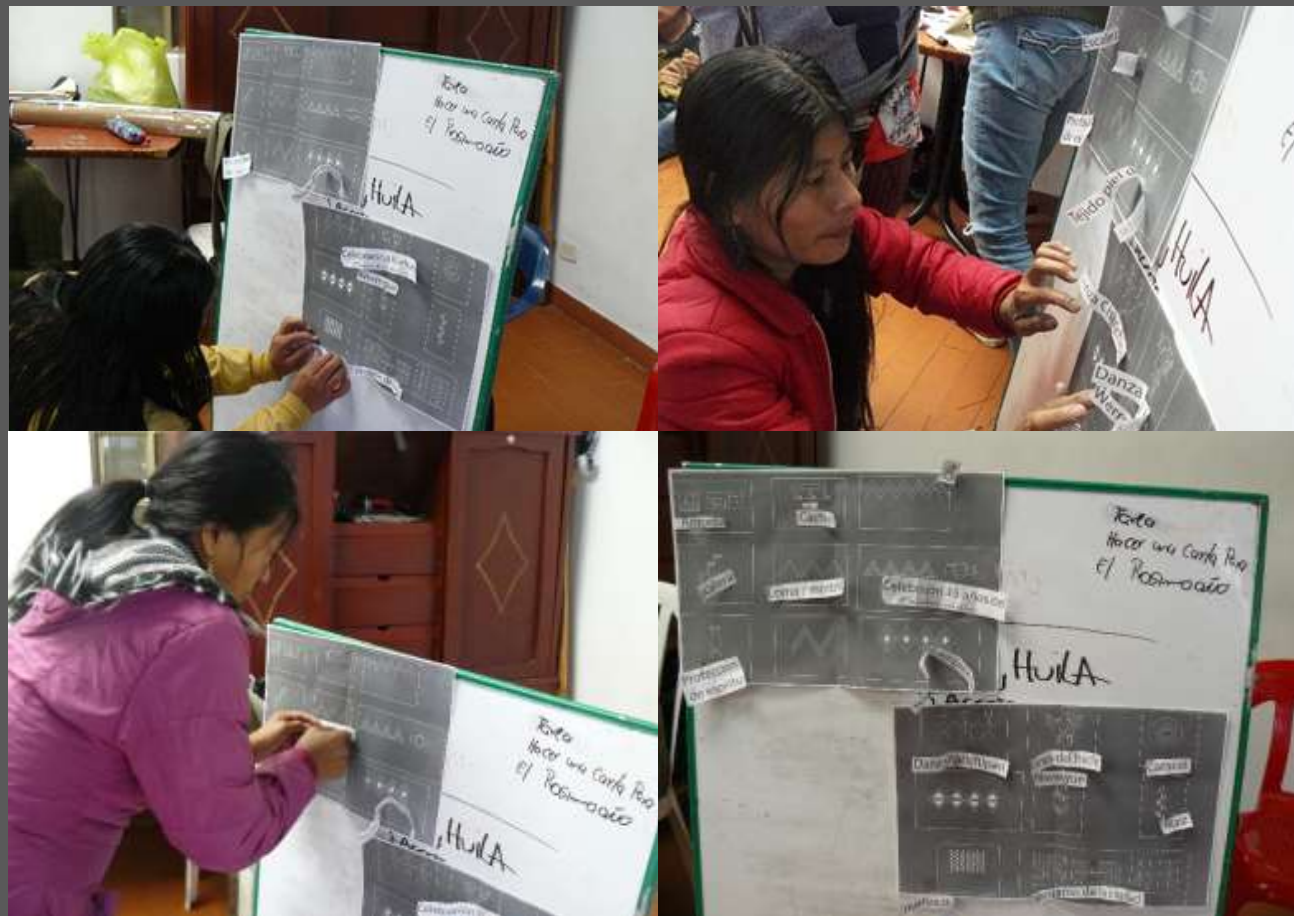
LUGAR: CIUDAD BOLIVAR, BOGOTÁ D.C

Todos los símbolos fueron reconocidos por la comunidad, lo cual asegura la implementación de estos en productos que generan identidad de su etnia.