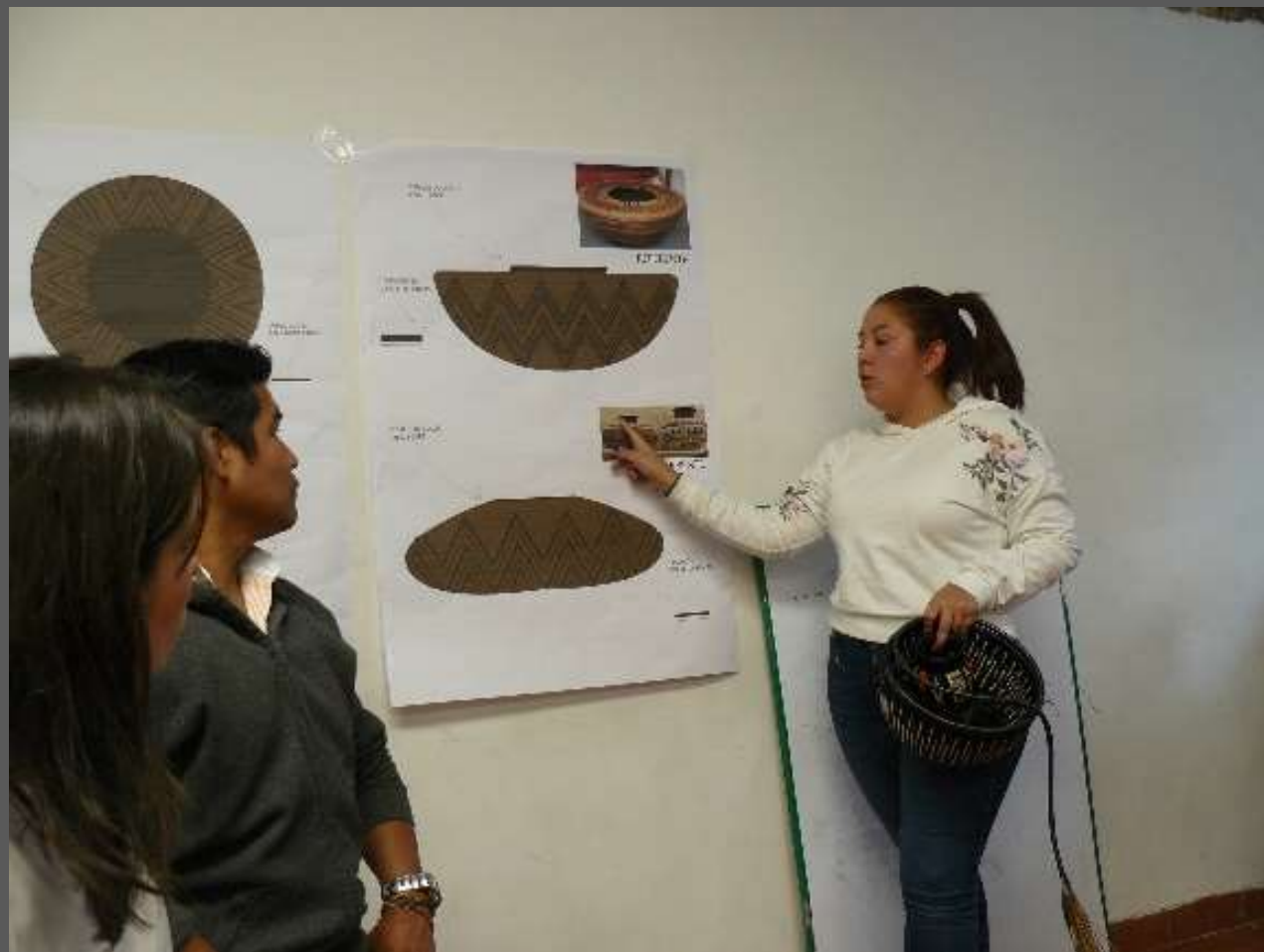
FOTOS TOMADAS POR: VALENTINA CHAUX LUGAR: CIUDAD BOLIVAR, BOGOTÁ D.C

Incrementar la productividad por medio de la línea de producto la cual fue generada de un proceso de Co Diseño y que busca resaltar la técnica y la simbología de una manera simple pero igual de comercial para beneficio de ellos.