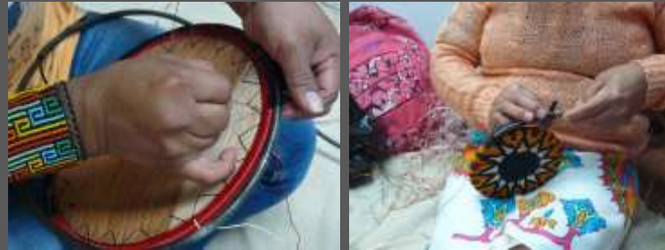
Cestería en Rollo