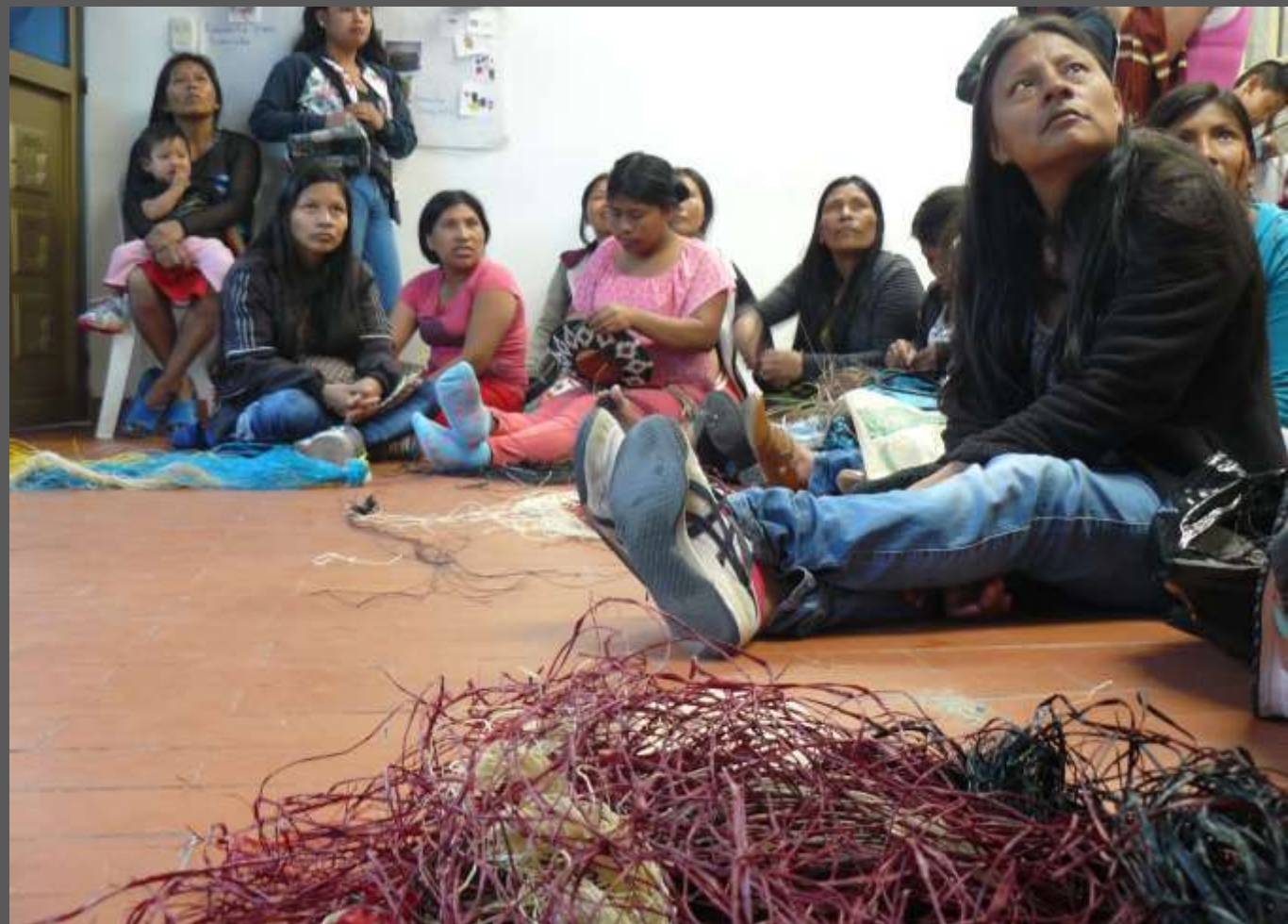
LUGAR: CIUDAD BOLIVAR, BOGOTÁ D.C