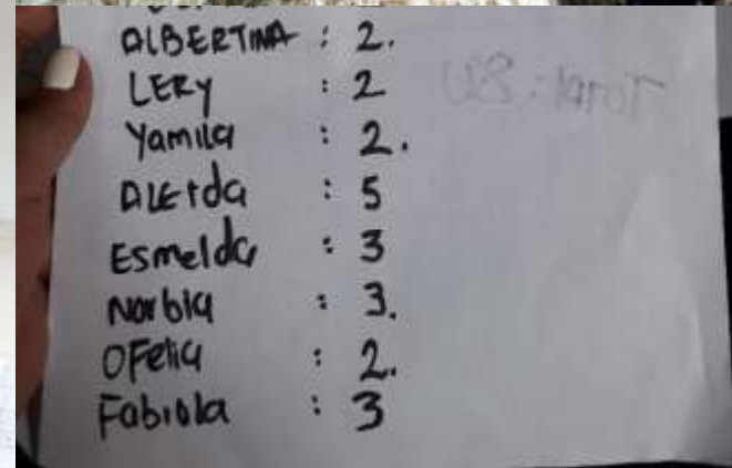
LUGAR: CIUDAD BOLIVAR, BOGOTÁ D.C