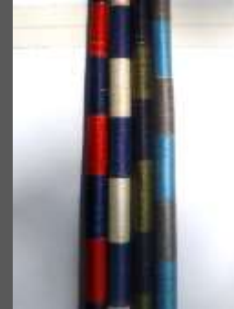
Tallado en madera, recubrimiento con hilo