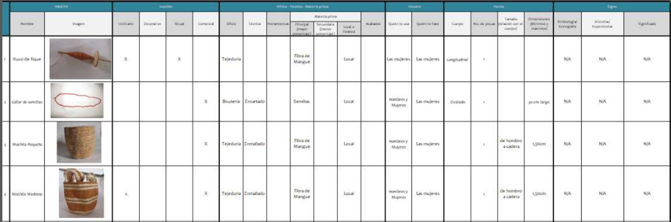
Imagen Referencia, COMPENDIO DE CULTURA MATERIAL YUKPA, CESAR

*Ver anexo Compendio de cultura material de la comunidad.