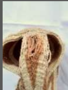
Uso predominante de franjas de color