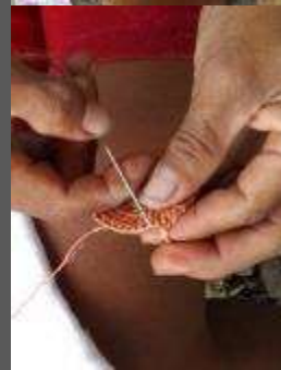
Tejeduría de punto