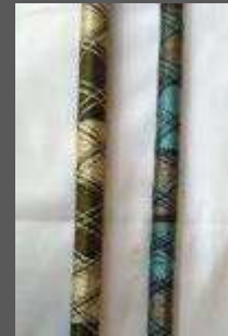
Uso de brea para fijar el hilo