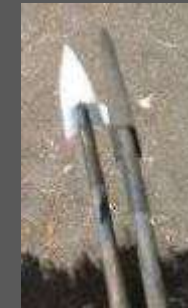
Recubrimiento con hilo como ensamble de las partes de las paletillas