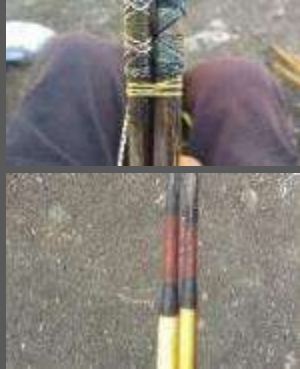
Macana, caña brava Hilo de nylon, brea