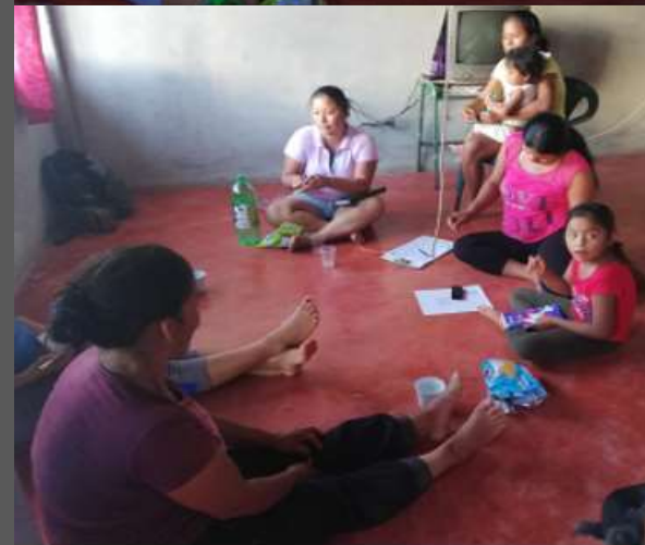
LUGAR: YUNGUILLO – MOCOA - PUTUMAYO