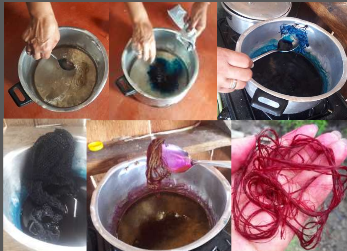
FOTOS TOMADAS POR: LAURA L. CAJIGAS LUGAR: YUNGUILLO – MOCOA - PUTUMAYO

Con la aplicación de color a las fibras naturales se logro dar un nuevo impacto a los productos elaborados siempre en el mismo color y además de mostrar productos de colores mas uniformes ya que algunos de color natural salen manchados debido a que la fibra no sale del mismo tono por que es extraída de diferentes plantas o en tiempos diferentes.