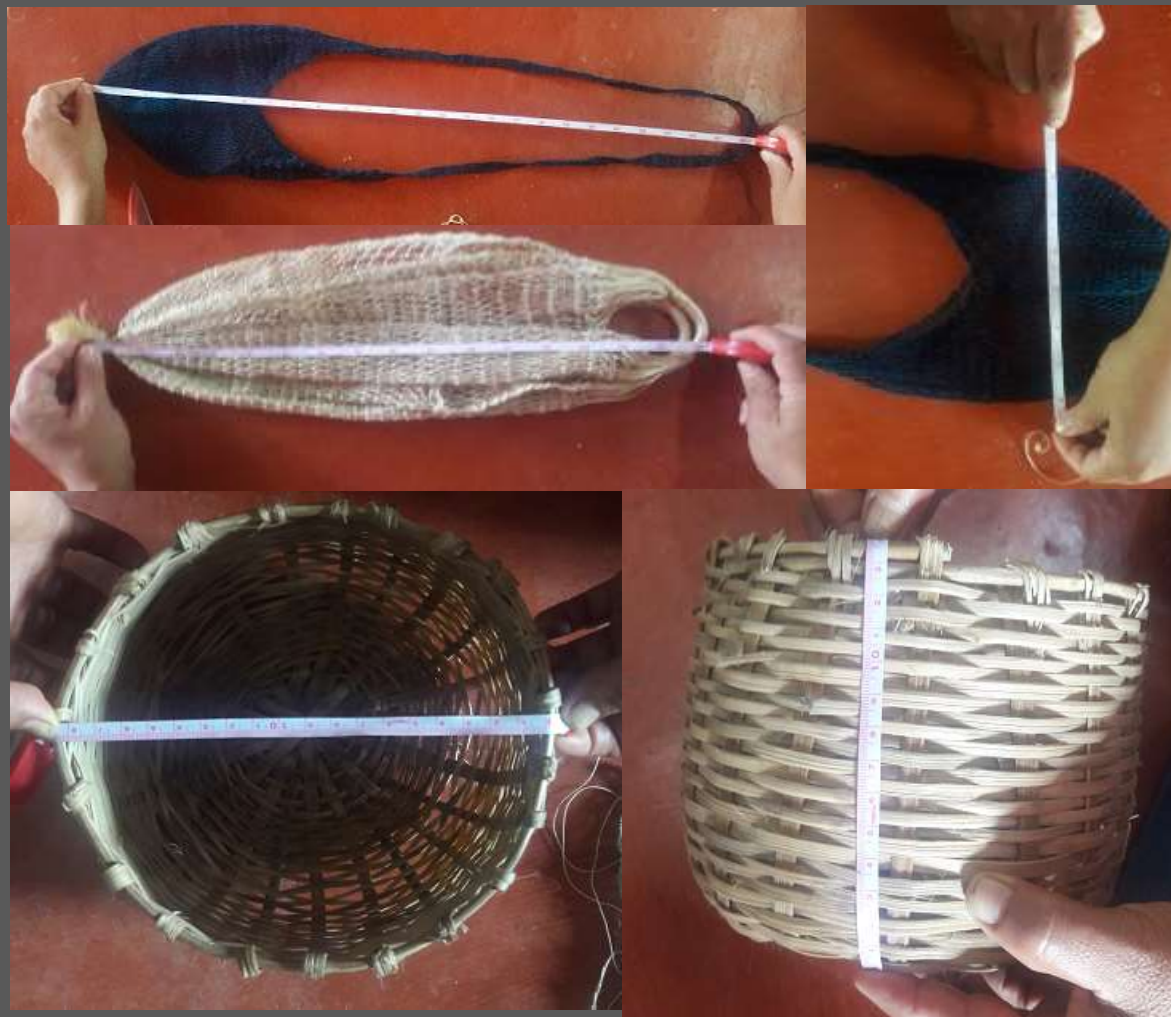
LUGAR: YUNGUILLO – MOCOA - PUTUMAYO

Se logró implementar medidas en los productos de acuerdo a su función, según format suministrado por Artesanías de Colombia, además de aplicar color y simbología