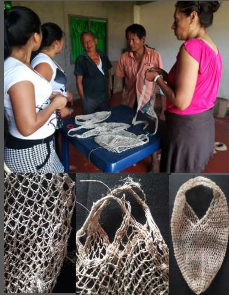
LUGAR: YUNGUILLO – MOCOA - PUTUMAYO

En la elaboración de las jigras se lograron camuflar muy bien los empates de fibra de tal manera que no se ven en el producto terminado evidenciando mejor la calidad del producto.