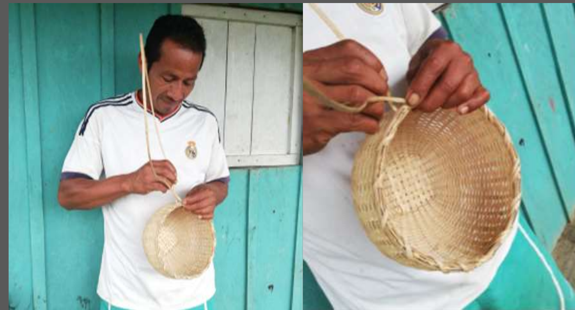
LUGAR: YUNGUILLO – MOCOA - PUTUMAYO