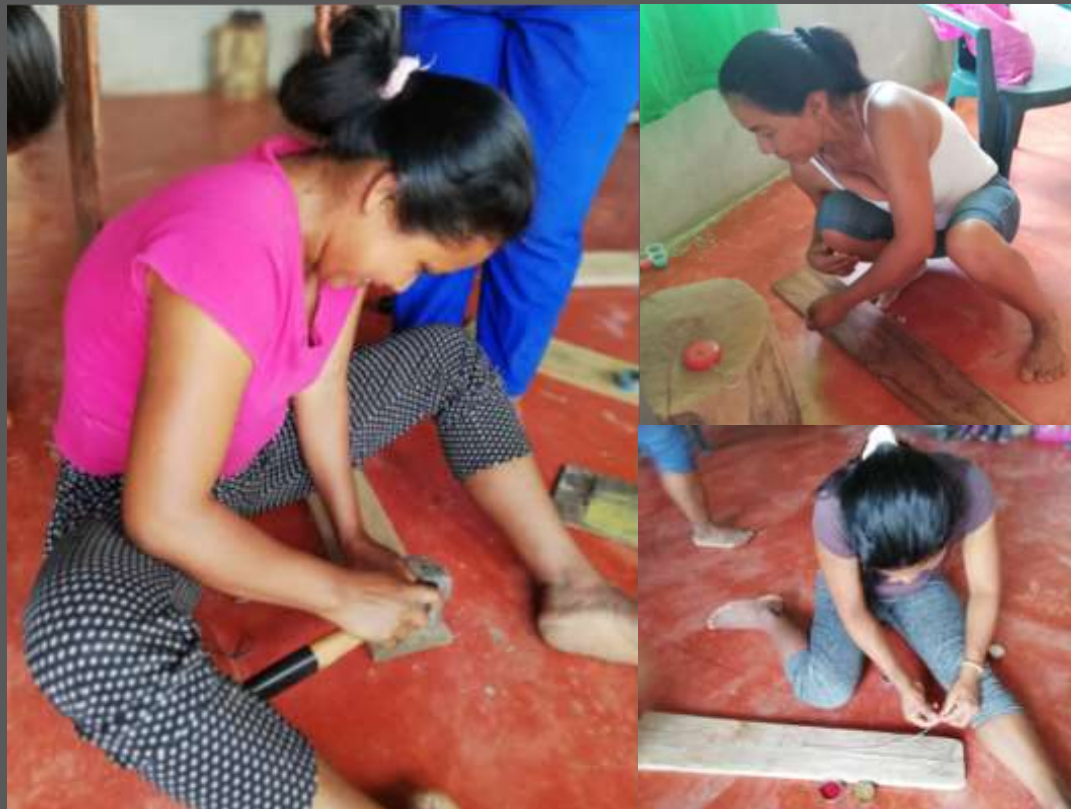
LUGAR: YUNGUILLO – MOCOA - PUTUMAYO

Con desarrollo de esta actividad se logro reforzar el manejo de la técnica de tejeduría y ensartado en chaquira para fortalecer en calidad terminados y acabados los productos que se elaboran en esta comunidad