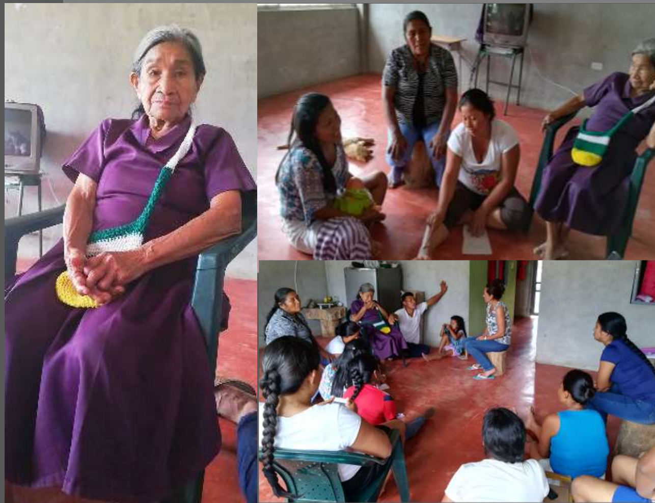
FOTOS TOMADAS POR: LAURA L. CAJIGAS LUGAR: YUNGUILLO – MOCOA - PUTUMAYO

Se logro concientizar a los integrantes del grupo sobre el conocimiento que tienen nuestros mayores y se esta perdiendo por que no hablamos con ellos y no nos preocupamos por aprender de ellos