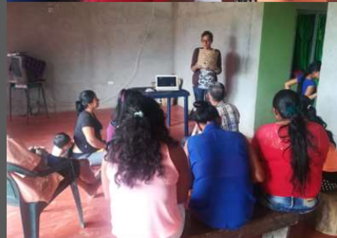
LUGAR: YUNGUILLO – MOCOA - PUTUMAYO