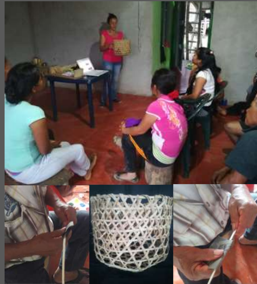
FOTOS TOMADAS POR: LAURA L. CAJIGAS LUGAR: YUNGUILLO – MOCOA - PUTUMAYO

Con esta actividad se logro mejorar la presentación del producto terminado evidenciando las fibras de color uniforme y muy limpias.