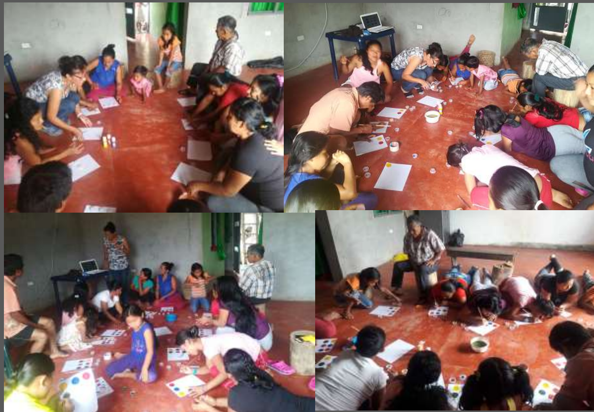
LUGAR: YUNGUILLO – MOCOA - PUTUMAYO

Con el taller de color se logro socializar un muestrario de color par identificar las gamas de color, teniendo en cuenta los colores existentes en el mercado y también se lograron identificar las diferentes combinaciones de color que se logran a través del círculo cromático