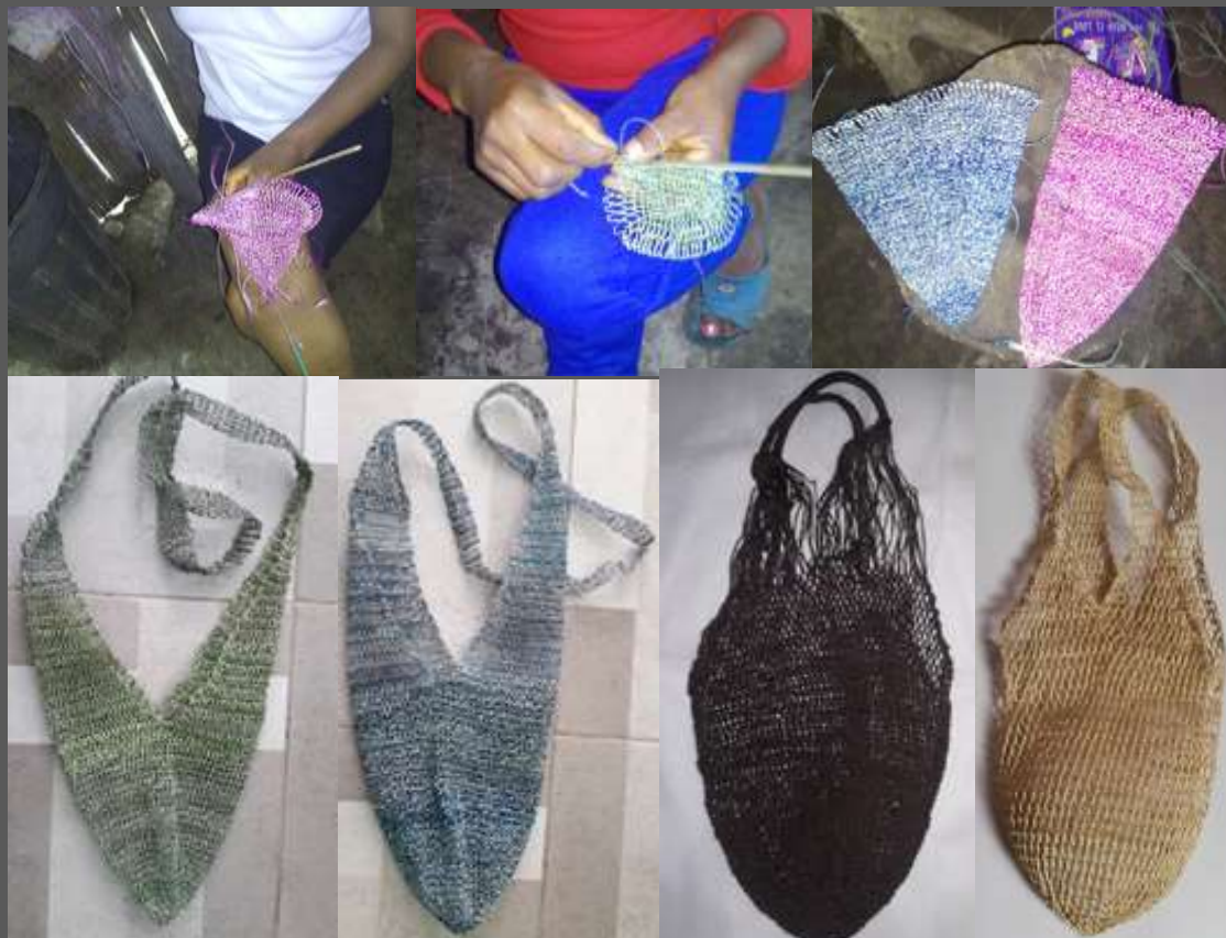
LUGAR: YUNGUILLO – MOCOA - PUTUMAYO

Se logro impactar con las diferentes funciones diseños y colores de las jigras tejidas con fibra natural de pita.