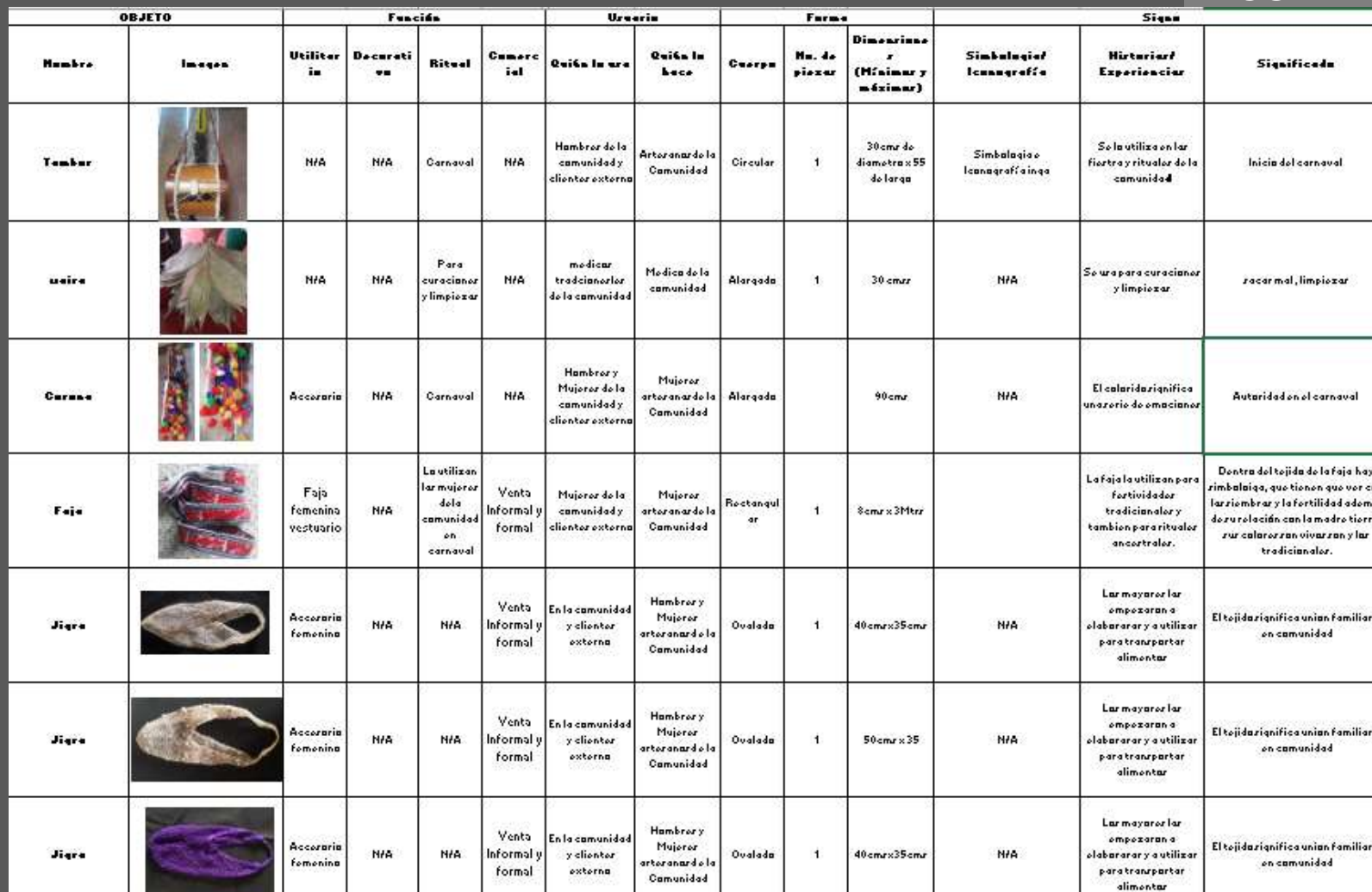
Imagen Referencia, COMPENDIO DE CULTURA MATERIAL INGA YUNGUILLO – MOCOA , PUTUMAYO

*Ver anexo Compendio de cultura material de la comunidad.