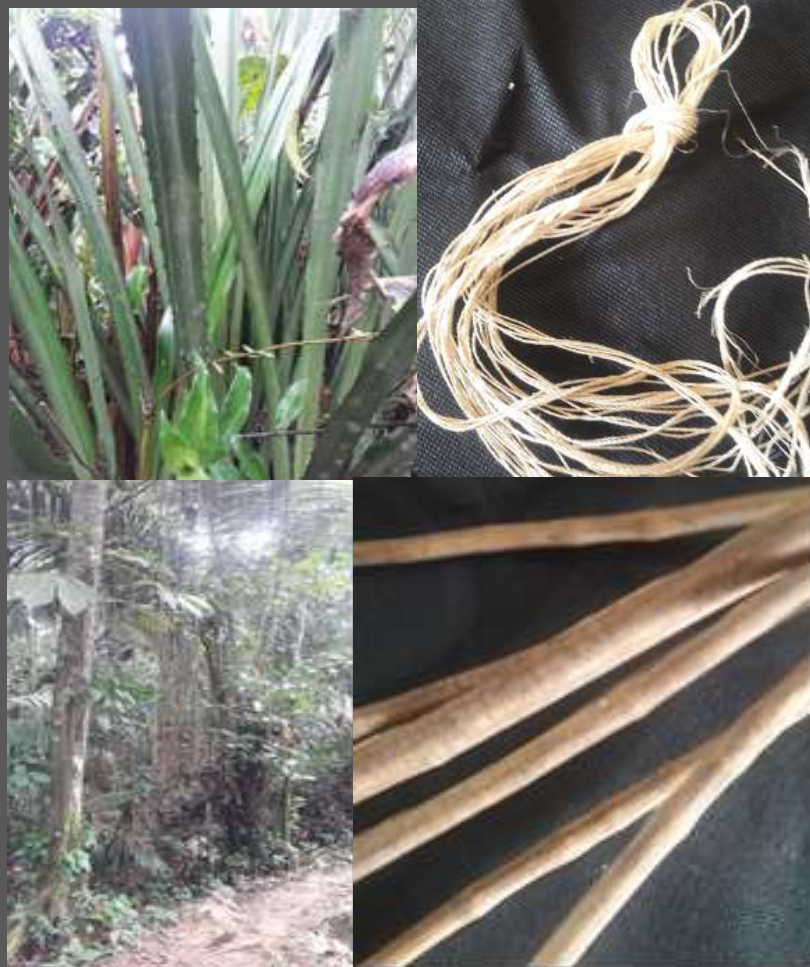
LUGAR: YUNGUILLO – MOCOA - PUTUMAYO

El mayor logro es conocer y compartir el proceso de extracción de las fibras tanto de yare como de pita y su posterior uso en la elaboración de los productos