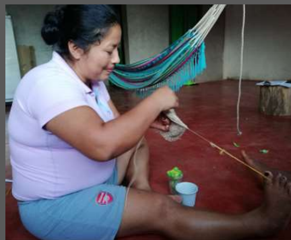
LUGAR: YUNGUILLO – MOCOA - PUTUMAYO