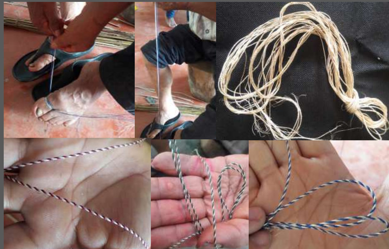
LUGAR: YUNGUILLO – MOCOA - PUTUMAYO

Se logro implementar color en las fibras naturales de Pita para generar nuevos productos de impacto en el mercado tanto local como regional