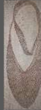
Tejido de punto