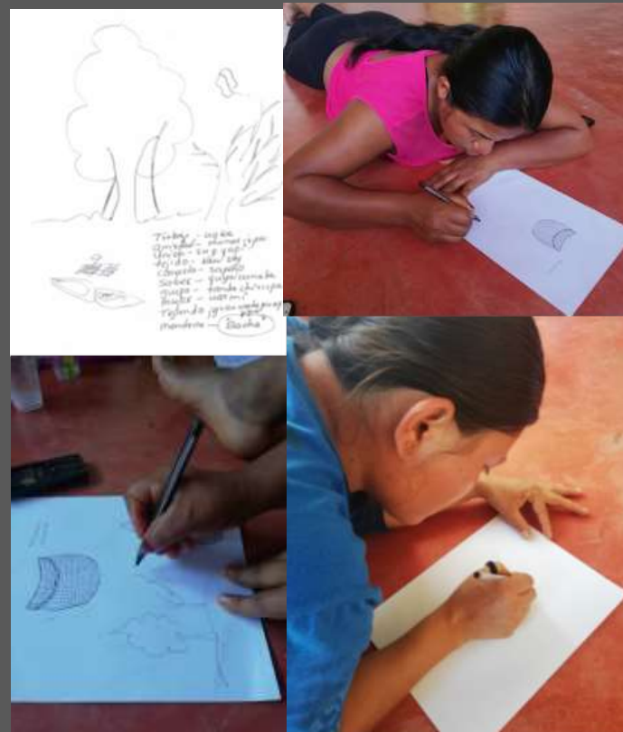
LUGAR: YUNGUILLO – MOCOA - PUTUMAYO

Con la realización de este taller se logro de manera conjunta escoger el nombre del grupo artesanal el cual los va a identifica en todos los eventos comerciales