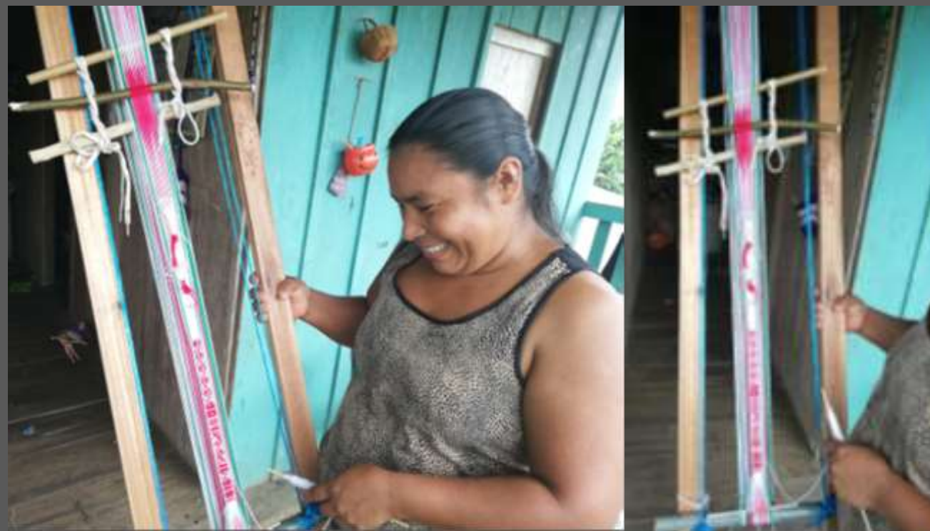
LUGAR: YUNGUILLO – MOCOA - PUTUMAYO

Con este taller se logra que el grupo de artesanos socialice la simbología propia de la comunidad inga reconozca sus símbolos que van hacer aplicados en los productos