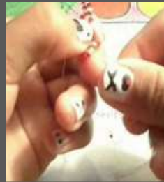
Tejido y ensartado en chaquiras