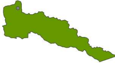
Mapa de ubicación geográfica del municipio de Mocoa