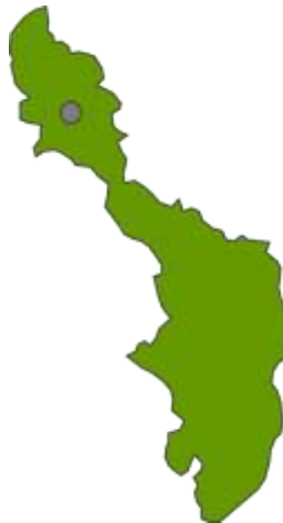
Mapa de la ubicación geográfica del municipio de Mahates

San Basilio de Palenque se encuentra localizado en el departamento de Bolívar, a sesenta kilómetros de la ciudad de Cartagena de Indias. Pertenece como corregimiento al municipio de Mahates, con una extensión aproximada de 30.000 hectáreas, ubicadas en los valles que están sobre los pies de los Montes de María. Limita al norte con Malagana y Palenquito, al sur occidente con San Pablo, y al oriente con San Cayetano.