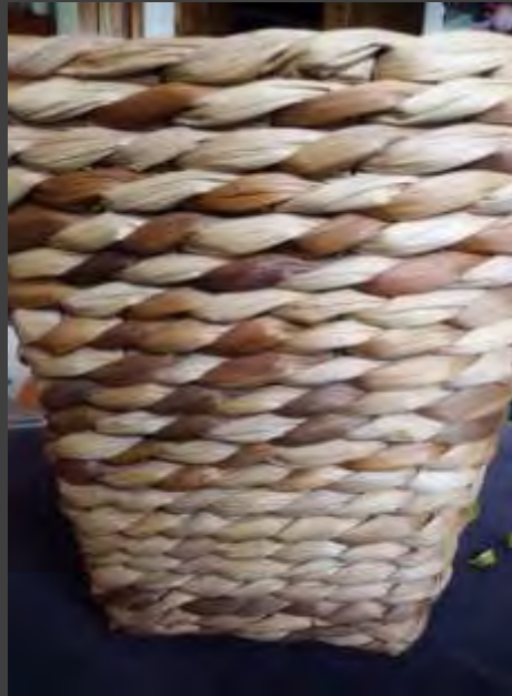
Ensayo torción Elaboración de 3 cajas organizadoras.