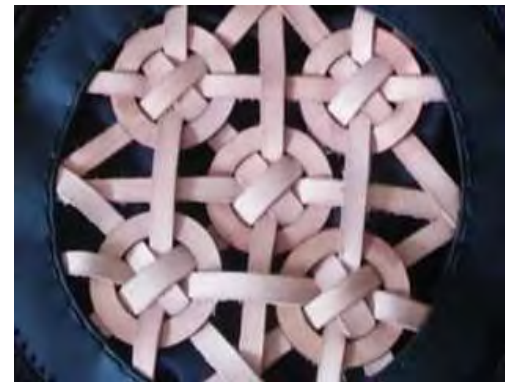
Tejido plano en tiras de cuero