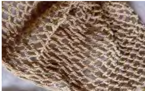
Punto red crochet