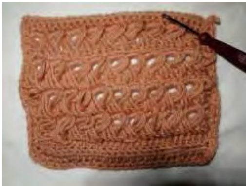
Tejido en crochet

Materiales: Hilos acrilicos - Hilos de bordar – Cuero