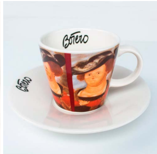
-Tienda Botero Piezas industriales varias.