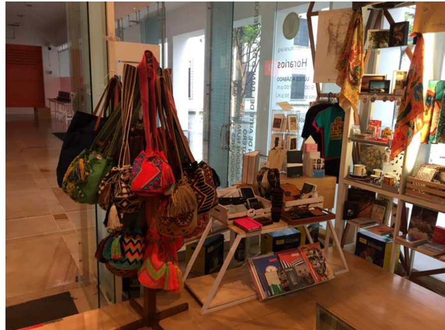
-Tienda de los Museos