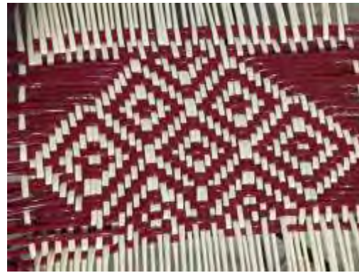
Pictograma tejido plano