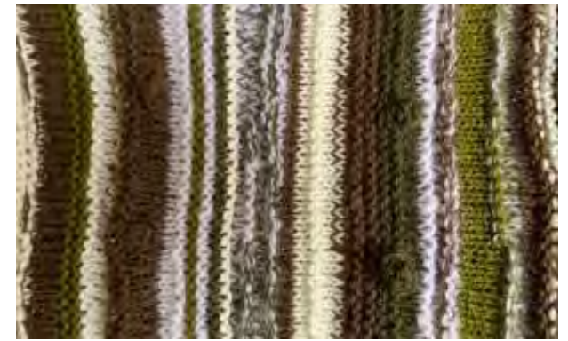
Texturas musgo en dos agujas