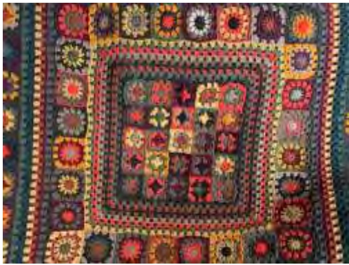
Crochet - granny square

Materiales: Lana – Hilo Acrilico – hilo pvc