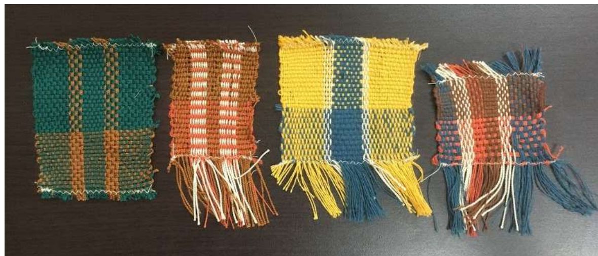
Muestras tejido plano