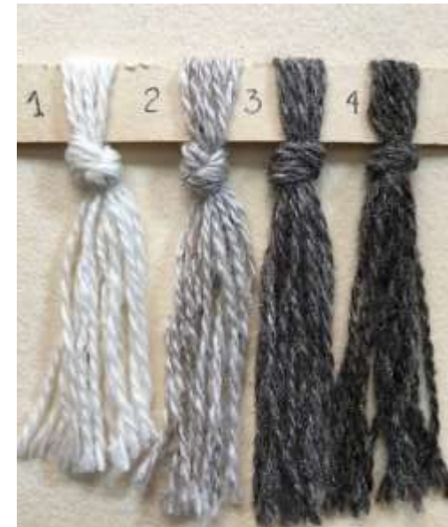
Muestras media lana