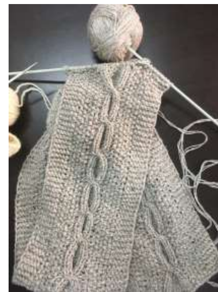
Muestras tejido en dos agujas con media lana