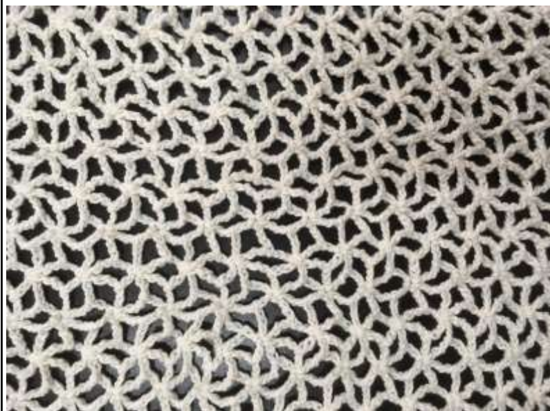
Muestras de Puntada en crochet