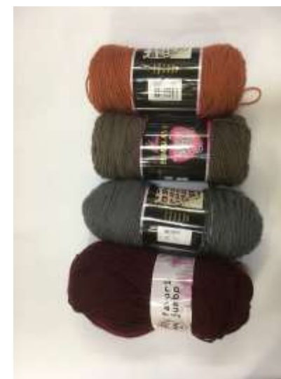
Muestras lanas acrílicas y mezclas