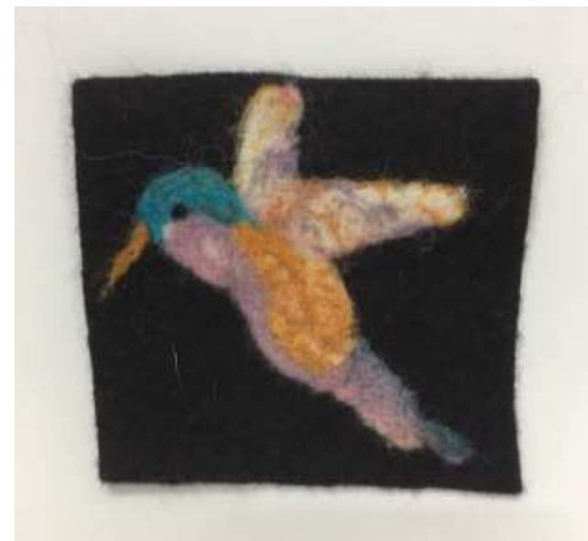
Muestra en fieltro en lana 100%