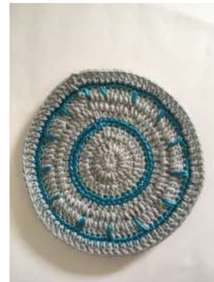
Muestras puntadas en crochet