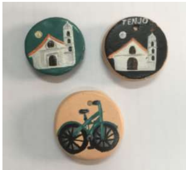
Muestras decoración de cerámica