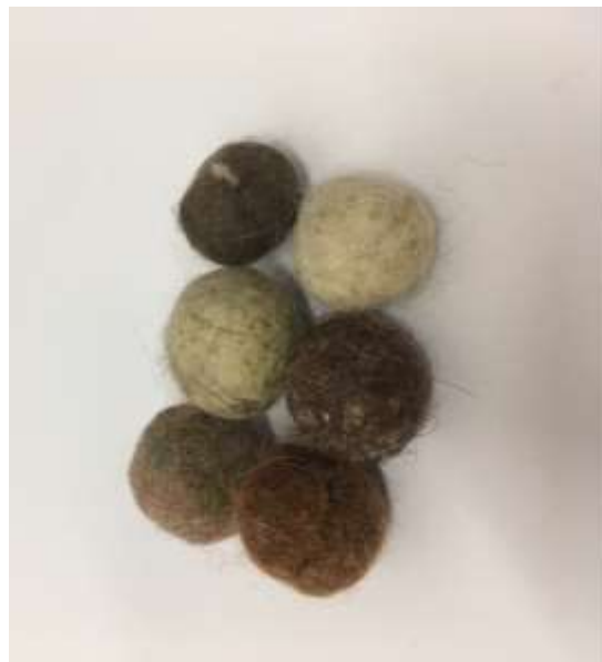
Muestra en fieltro en lana 100%