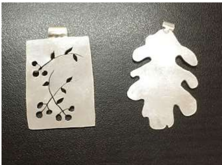
Muestras calado sobre plata