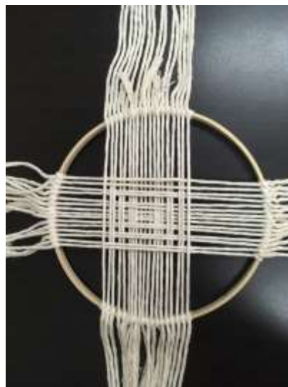
Muestra de tejido entrecruzado