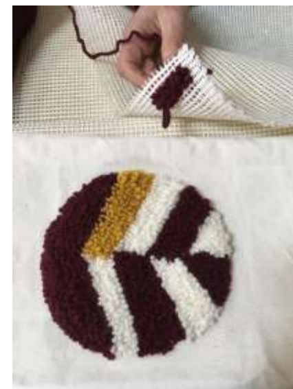
Muestras bordado ruso