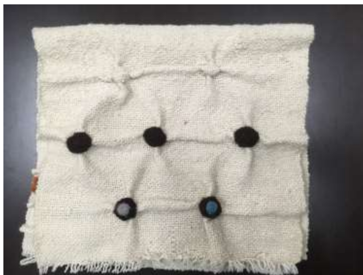
Muestras de fieltro bordado sobre tela de lana