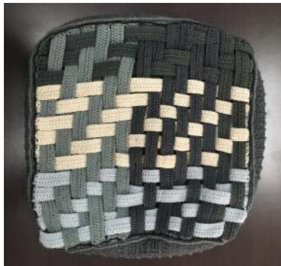
Muestras tejido en crochet