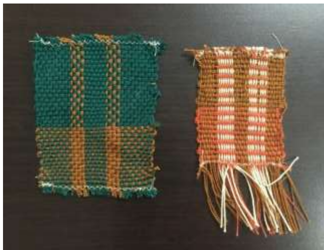
Muestras tejido plano