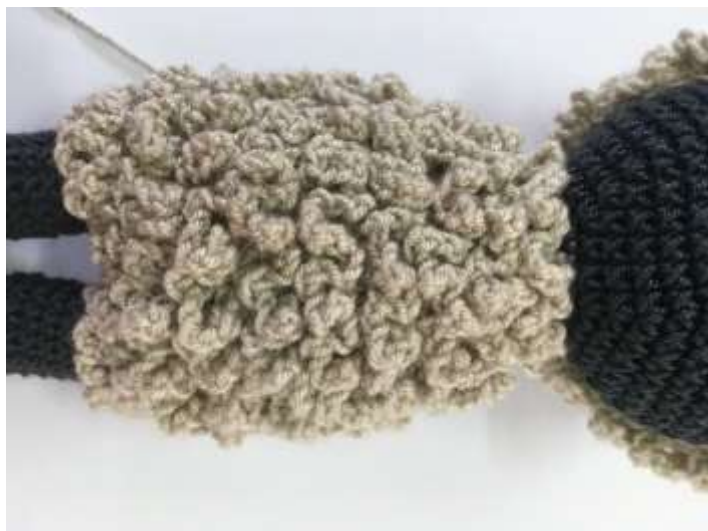
Muestras tejido crochet

Material: Hilo crochet / Hilazas de algodón