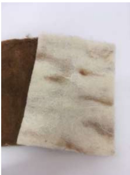
Muestra de fieltro en lana 100%