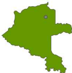
Mapa de ubicación geográfica del municipio de Mitú

El departamento del Vaupés consta con una división administrativa correspondiente a 3 municipios; Mitú su capital, Carurú y Taraira, es uno de los 6 departamentos amazónicos colombianos, limita al norte con Guainía y Guaviare, al sur oeste con Caquetá, al sur con el Amazonas y al este con Brasil. Su altitud promedio es de 188m.sn.m. y está demarcado por ríos, se puede acceder desde el resto del país por vía fluvial o aérea. Algunos de sus ríos principales son el Vaupés, el Caduyarí, el Querarí, Tiquié, Pirá Paraná, Isana, Papurí y Taraira. Cuenta con al menos 26 pueblos indígenas, cada uno con sus respectivas lenguas, tradiciones, usos y costumbres, los cuales interactúan en lo que ha sido denominado el “complejo sociocultural del Vaupés” (Martínez, Montoya, Caicedo, 2015).