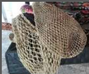
Tejido de punto