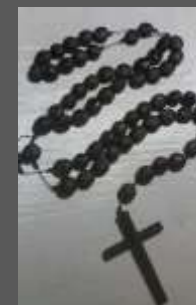
Tejido y endartado en Semillas