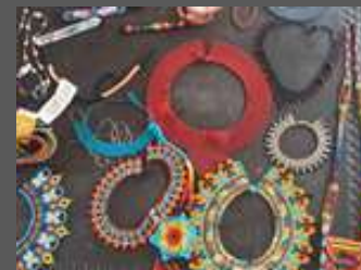
Tejido y ensartado en Chaquira