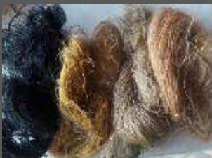
Fibra de cumare