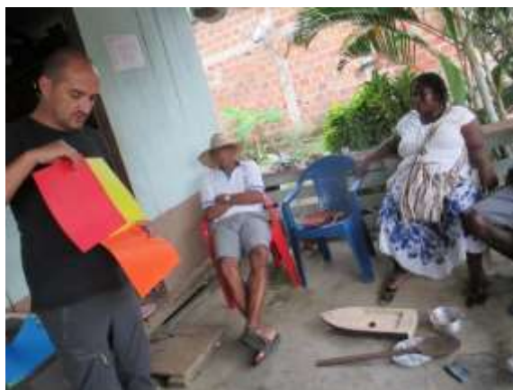
“programa de fortalecimiento productivo y empresarial para pueblos Indígenas y comunidades Negras, Afrocolombianas, Raizales y Palenqueras- NARP en Colombia”

Este taller fue necesario impartirlo para que una beneficiaria que trabaja con damagua pudiera obtener más colores partiendo de la combinación de los colores primarios.