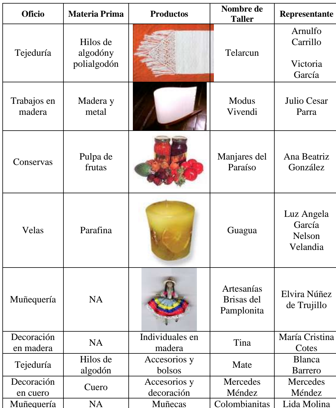
Tabla 2. Talleres Artesanales asesorados en diseño gráfico. Marzo - Abril 2006