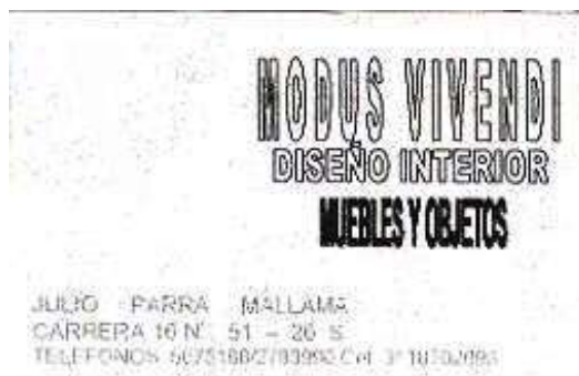
Material entregado por Modus Vivendi: Tarjeta de presentación. Bogotá - Cundinamarca.Marzo 2006.

Expectativa de la asesoría: Diseño de logo, diseño de aplicaciones básicas: tarjeta y etiqueta de producto. Diseño de portafolio de productos.