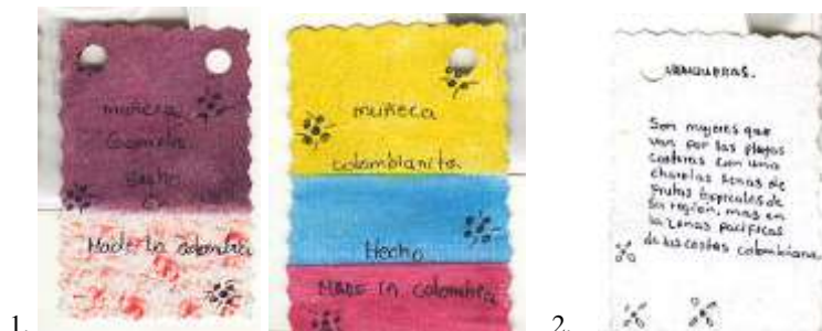
Material digital entregado por Colombianitas: 1. Frente de etiqueta. 2. Dorso de etiqueta. Bogotá - Cundinamarca. Abril 2006.

Empresa unipersonal creada desde hace un año. Integrada por dos (2) personas. Su actividad es la producción de manualidades. Su fortaleza es la creatividad y variedad de muñecas. Su producto va dirigido a la mujer (niña-adolescente) colombiana. No posee punto de exhibición. No tiene logo. Tiene etiqueta de producto. Expectativa: Diseño de logo, diseño de etiqueta y portafolio de producto.