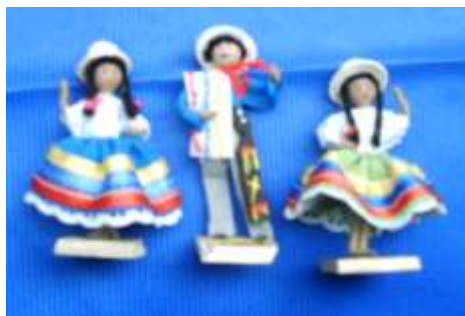
Material digital entregado por Brisa: Fotografía de producto. Bogotá - Cundinamarca. Marzo 2006.

Expectativa: Diseño de portafolio de producto.