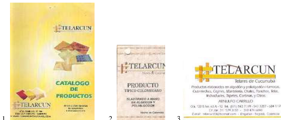
Material entregado por Telarcun: 1. Catálogo; 2. Etiqueta 3. Tarjeta de presentación. Bogotá - Cundinamarca.Marzo 2006.