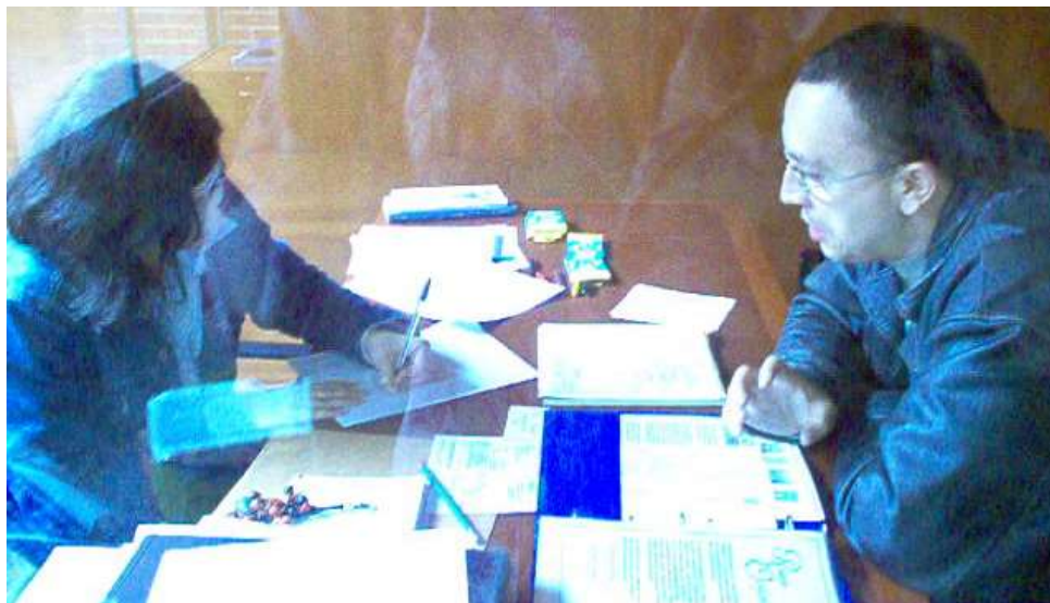
Artesano respondiendo el cuestionario de diagnóstico gráfico. Asesorías Puntuales Bogotá - Cundinamarca. Marzo 2006.

Expectativa: Diseño de logo, etiqueta y portafolio de producto. Nota: Al momento de iniciar la asesoría el taller no tenía nombre.