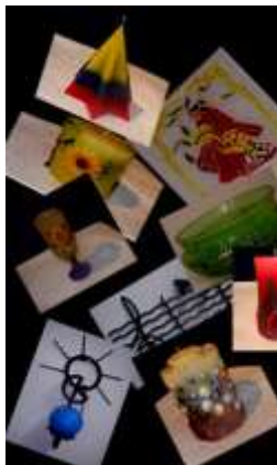
Material entregado por Guagua: Hoja de portafolio de producto Bogotá - Cundinamarca. Marzo 2006.

Expectativa: Evaluación del logo y portafolio de producto. Nota: El nombre del taller artesanal era Decor Anguie.