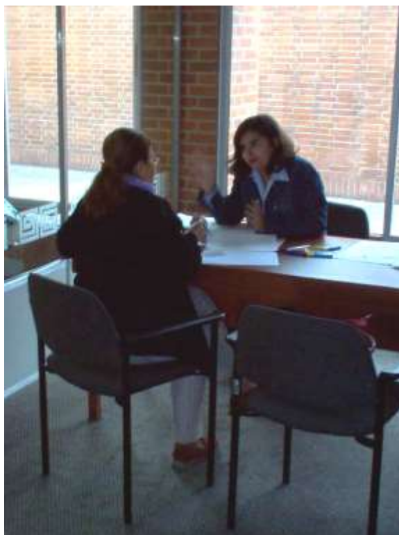
Socialización de los resultados del cuestionario y planteamiento de propuesta. Asesorías Puntuales Bogotá - Cundinamarca. Abril 2006.

Presentación y aprobación del logo en las aplicaciones tarjeta de presentación y etiqueta. El portafolio de producto tipo plegable fue modificado en tamaño. Se seleccionaron las fotos de producto, muestras de tejidos y color para el portafolio. También se entregó el texto en ambos idiomas por parte de los beneficiarios. Se seleccionó el soporte y tipo de impresión.