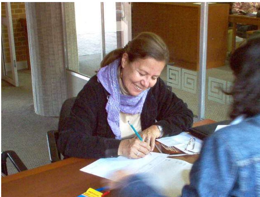
Artesana desarrollando bocetos de imagen gráfica. Asesorías Puntuales Bogotá - Cundinamarca. Abril 2006.

Fue un caso de rediseño de imagen. La deficiencia en su imagen era manejar un lenguaje propio de productos industriales, a pesar de hacer referencia en el texto a que es un producto 100% natural. El manejo varios tipos de envase y de rotulado (etiqueta y adhesivo) sin mantener relación cromática en ninguna de las aplicaciones. La propuesta fue conservar la tipografía cursiva para no romper totalmente con la imagen anterior y no perder el reconocimiento del cliente habitual, diseñar una imagen acorde con la actividad manual, unificar el manejo de rotulación a una sola aplicación: etiqueta tipo plegable, tarjeta de presentación y la posibilidad de hacer un portafolio de producto, esta aplicación será evaluada dependiendo del material fotográfico que suministre el beneficiario.