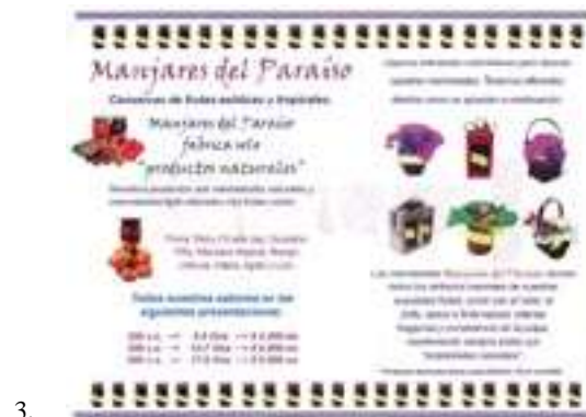
Material entregado por Manjares del Paraíso: 1. Adhesivo; 2. Etiqueta; 3. Hoja de presentación. Bogotá - Cundinamarca. Marzo 2006.