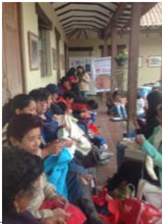
Municipalidad de Ubaté, sitio de reunión.