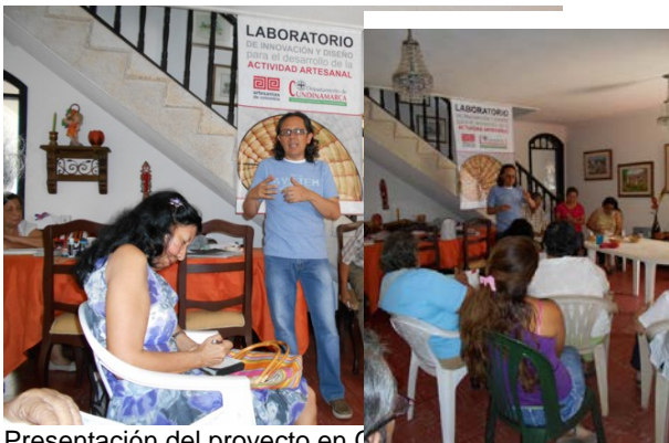
Presentación del proyecto en Girardot Taller de Acabados con cera de abejas con aceite mineral-Girardot