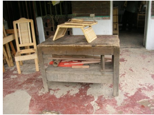
Taller de Adán Mayorga-Silvania, Foto tomada por D.I. Roger Álvarez