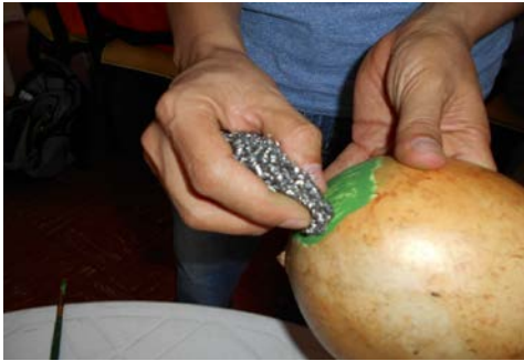
T taller de Acabados con cera de abejas con aceite mineral-Girardot, Foto tomada por:D.I.