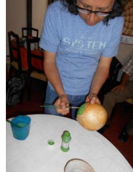
T taller de Acabados con cera de abejas con aceite mineral-Girardo, Foto tomada por:D.I. Roger Álvarez