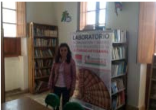
Presentación del proyecto en la biblioteca del municipio de Cajicá.