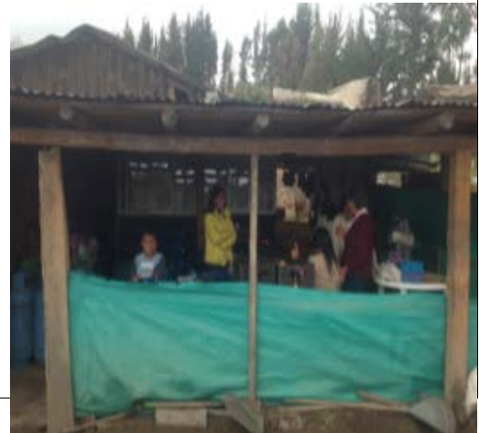
Sitio de trabajo de las artesanas de la vereda-Tausa.