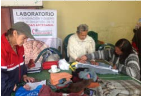
Salon comunal, centro de reunion Municipio de Sutatausa.