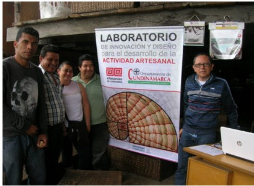
Presentación del proyecto en Silvania