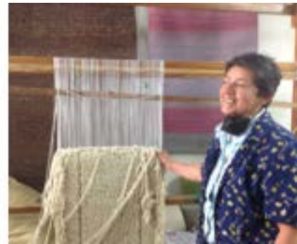
Inscripción de los beneficiados, para información de su base de datos - Cajica.