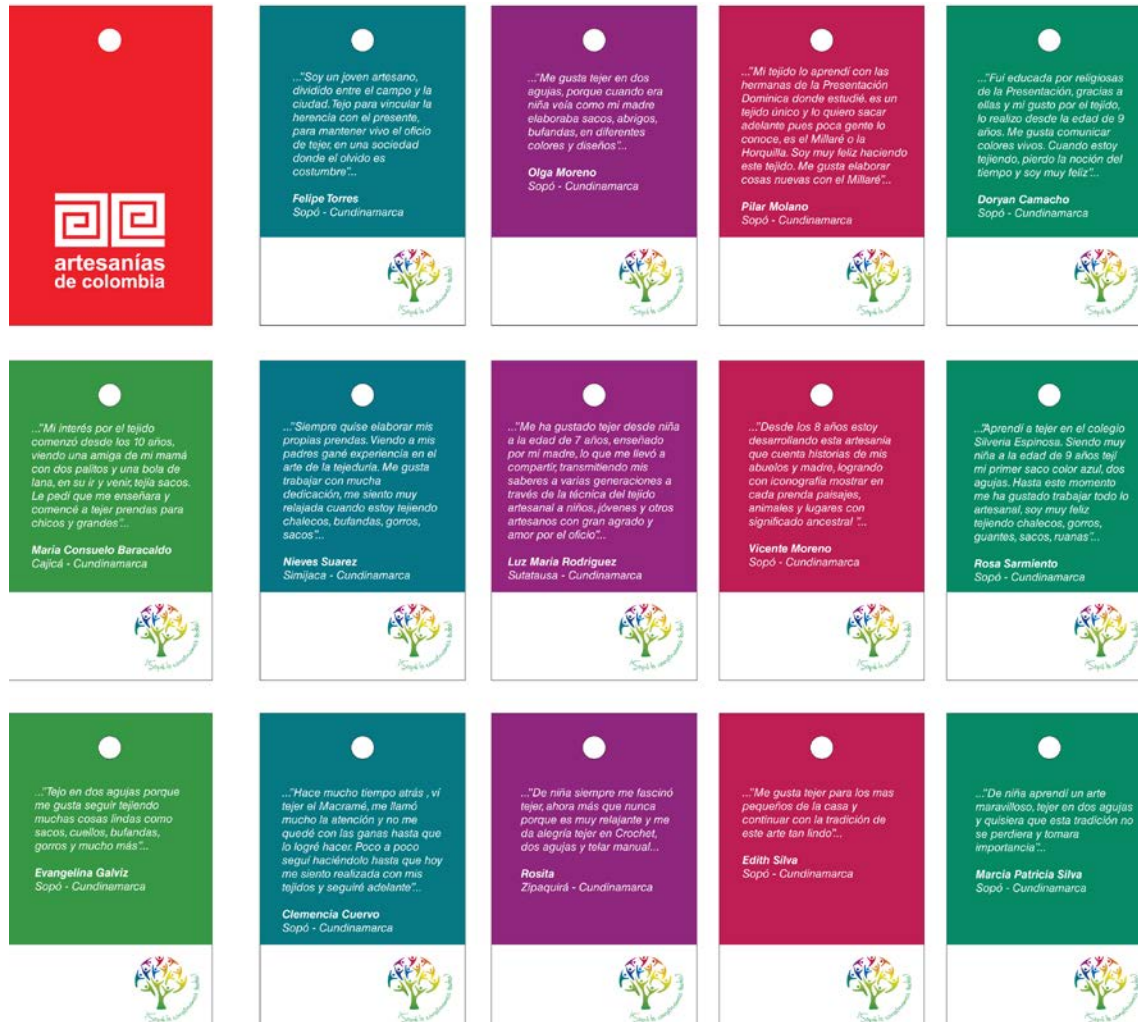
Cara frontal roja con el logo de artesañas de Colombia y caras posteriores en diferentes colores , con las palabras del artesano

a ción de la matriz gráfica “Compendio de cultura material” para Cundinamarca 2016,