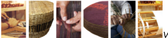
olante Feria Regional Sopó _ cara frontal