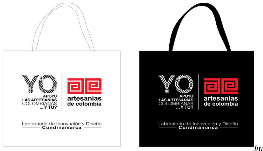
aden para empaques

2.2. Imagen Feria Local Artesanal: Dentro de las actividades alternas programadas por el operador, se está desarrollando la imagen del evento: “Feria Regional de Artesanos de Cundinamarca” a realizarse en el municipio de Sopó durante los días 12 y 13 de diciembre. El material gráfico se compone de: afiche, backing para tarima, volantes, pasacalles, imágenes para redes sociales y señalización para carpas de cada municipio.