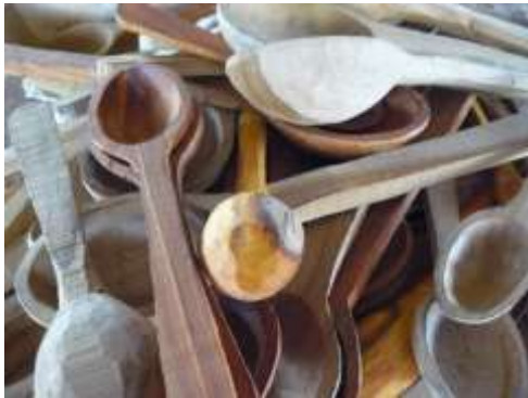
Procesos en madera realizado por los Hombres.

elementos que se producen. A pesar de esto se ven algunas caras jóvenes dentro de la asociación, muchachos que siendo hijos, sobrinos o nietos de artesanos, han quedado atraídos por el oficio y desean convertirlo en su labor principal de vida. Para ellos la playa ya no es necesaria como lugar de aprendizaje, pues el taller de la asociación, permite la enseñanza y práctica.