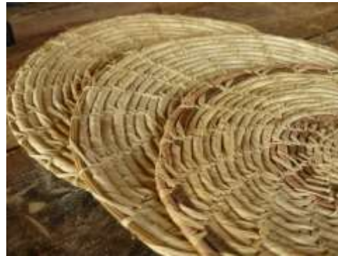
Tejeduría en Ceba de