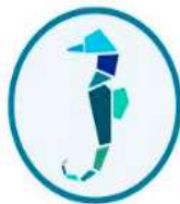
DAH FIWI MACHÉ