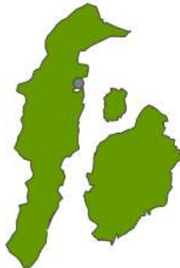
Mapa de la ubicación geográfica del municipio de San Andrés

El archipiélago de San Andrés, Providencia y Santa Catalina se encuentra ubicado en el mar caribe, siendo el único departamento del país Colombiano que no tiene territorio continental, se encuentra conformado por diferentes conjuntos de islas, cayos e islotes; a 720 km de la costa Colombiana y a 110 km de la costa nicaraguense.