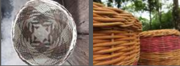
Bejuco ratón , bejuco lucateva