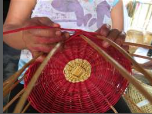
Talla en madera, cestería , moldeado de arcilla