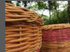
Los remates deben quedar apretados