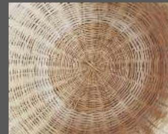
El tejido debe estar apretado y los armantes rectos.