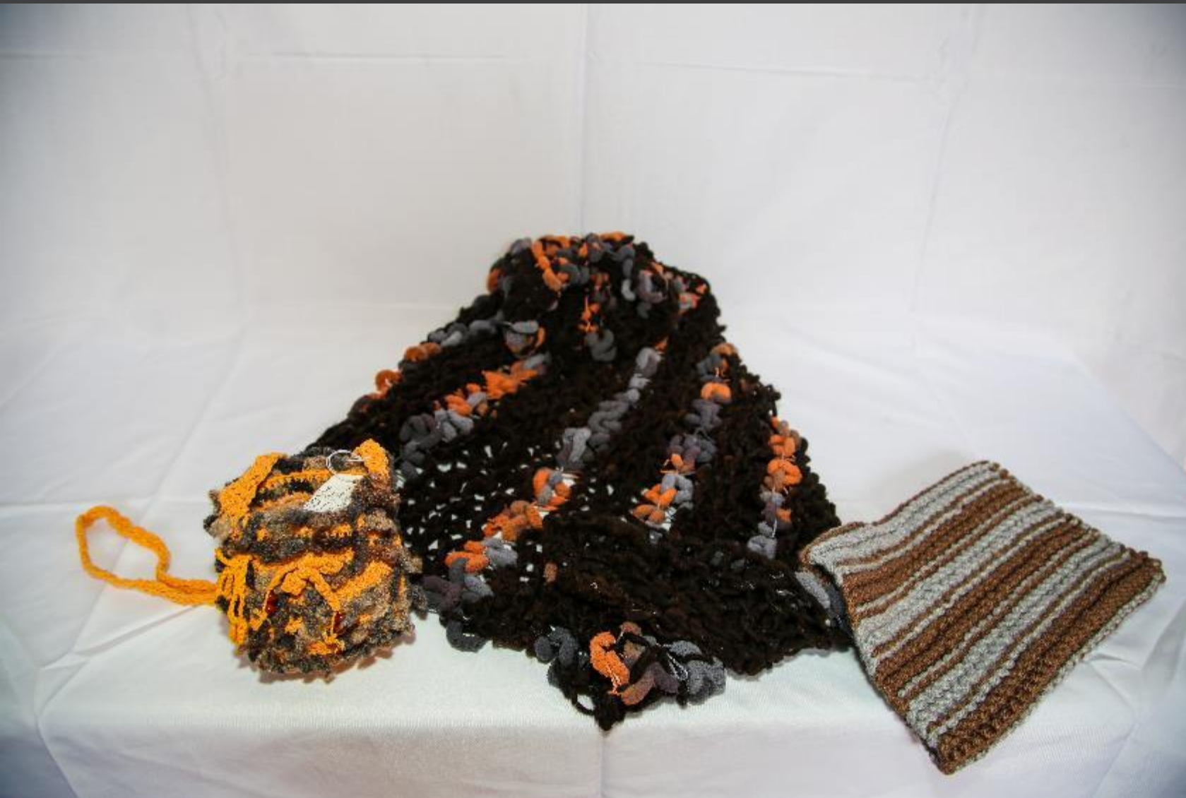
Artesano Cecilia Espinel Oficio Tejeduría (crochet)