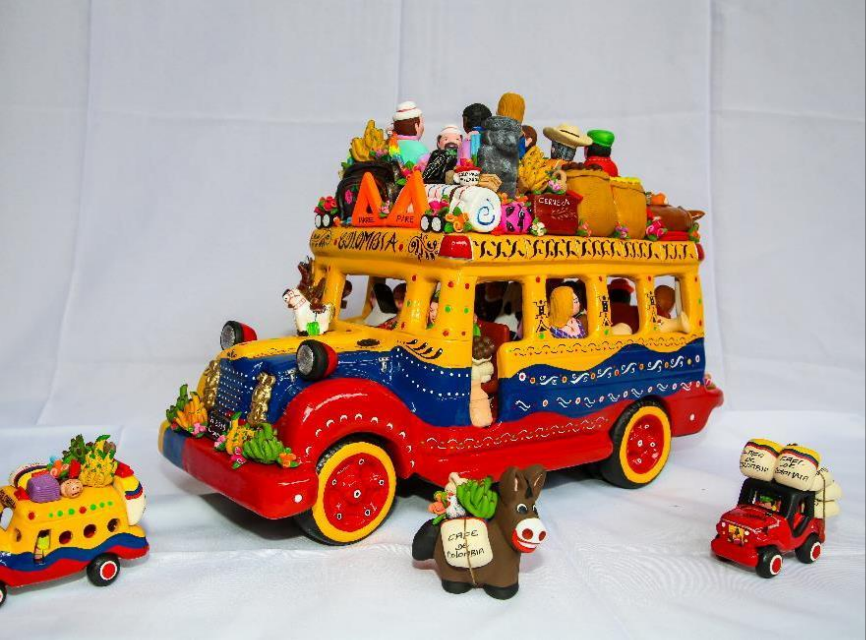
Artesano Julio Correales Oficio Ceramica