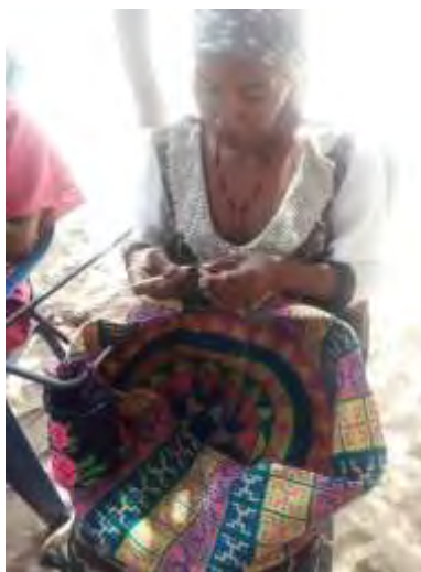
Artesana de la comunidad tejiendo la Mochila Susu.

Se espera que durante el desarrollo del programa la comunidad de Maima Jasay pueda hacer de su artesanía una institución de cambio en la comunidad y que a través de esta actividad se garantice el bienestar de las familias y se salvaguarde el saber. Es necesario para el año siguiente fortalecer el valor comercial para efectos de intercambio, el valor finalmente termina siendo incuantificable, dada todas las implicaciones y complejidades culturales transmitidas de generación en generación que convergen en cada producto. Sin embargo es necesario generar una identidad cultural al producto que lo fortalezca tanto como una marca comercial.