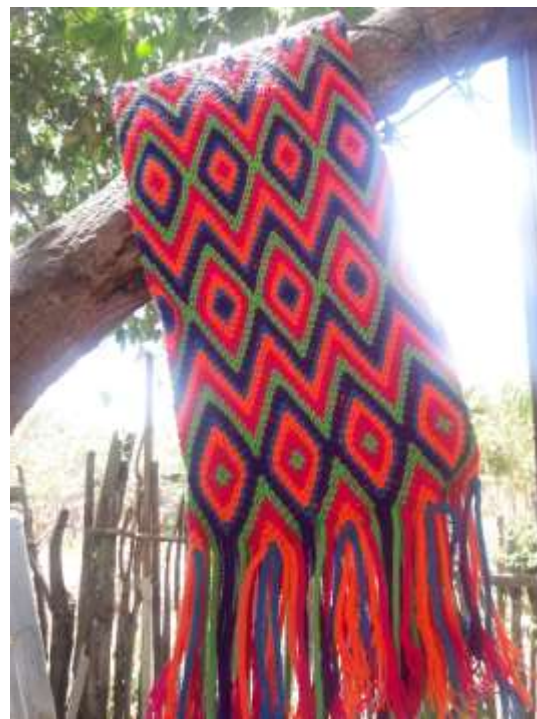
Gasas Maima Jasay

El desarrollo de la artesanía cumple con múltiples funciones, de una parte aporta a la generación de empleo e ingresos que contribuye al bienestar de la comunidad y a la construcción de tejido social; por otro lado, el desarrollo de esta actividad aporta de manera significativa al rescate y enriquecimiento de la cultura, a la afirmación de la identidad de las comunidades, de las regiones y de la nación, así como a la proyección de la imagen de un país diverso y productivo a nivel internacional.