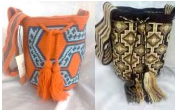
Combinaciones de colores de Maima Jasay

son de las comunidades con mayor interés de aprender de las combinaciones de colores y de crear productos acordes a las tendencias, mostrando una notable sensibilidad en la distinción de las diferentes tonalidades de color que pueden usarse en un producto.