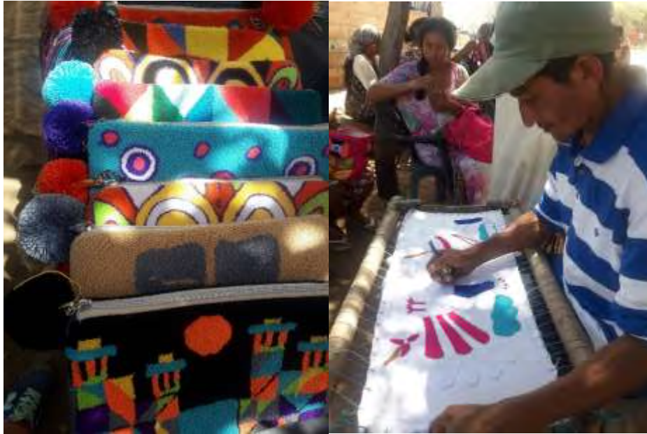
Técnica de Pellón.

Moldería para disminuir tiempos de producción