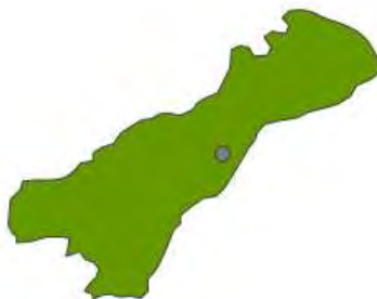
Mapa de la ubicación geográfica del municipio de Maicao