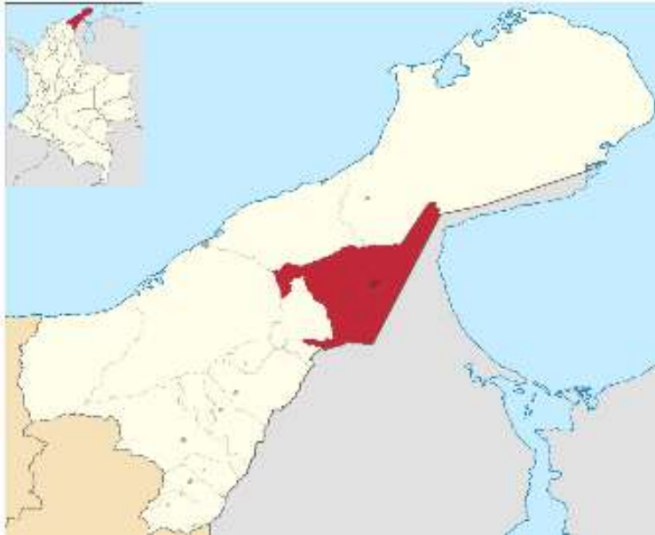
Ilustración 1 Mapa de la Guajira, Municipio de Maicao.

En la península de la Guajira, hacia el noreste de Colombia y sobre las riveras del mar caribe se encuentra ubicado el Departamento que recibe el mismo nombre. Conformado por 15 municipios, 48 corregimientos y 142 centros poblados entre corregimientos, inspecciones de policía y caseríos. Con una extensión de 20.848 km 2 , que representan el 1.8 % del territorio nacional. Está situado en el extremo norte del país y en la llanura del Caribe, en la parte más septentrional de América del Sur. Limita por el norte con el mar Caribe, por el oriente con el mar Caribe y la República de Venezuela, por el sur con el departamento del Cesar y por el occidente con el departamento del Magdalena y el mar Caribe.