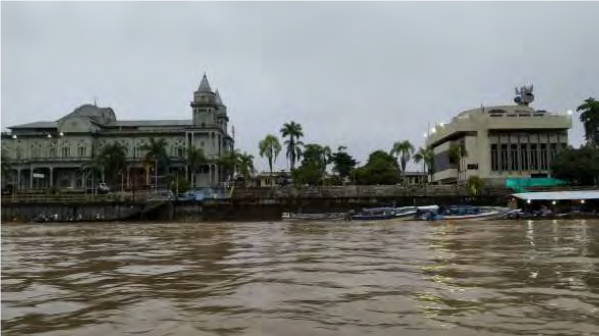
Malecón de Quibdó

Apertura