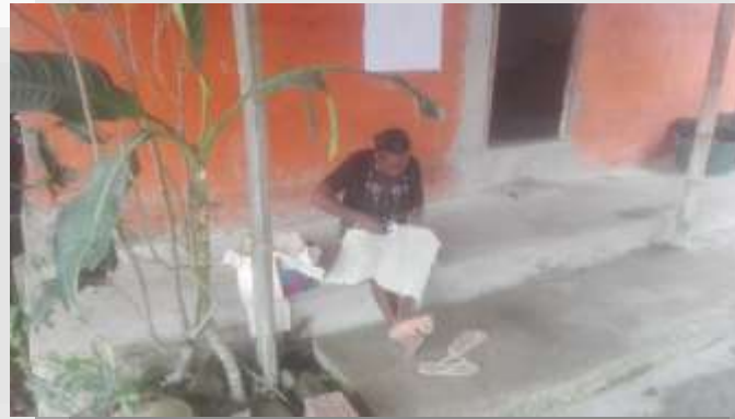
Imagen de Campo - 2018

Los habitantes del corregimiento de Villa Conto, se caracterizan por su hospitalidad y calidad humana, brindando así su alegría, respeto y amabilidad con los turistas que llegan a visitarlos. Por otro lado, este corregimiento en la actualidad está en una encrucijada pues la minería ilegal junto con la presencia de varios grupos armados ha convertido a esta zona en un foco de conflicto, violencia y desplazamiento.