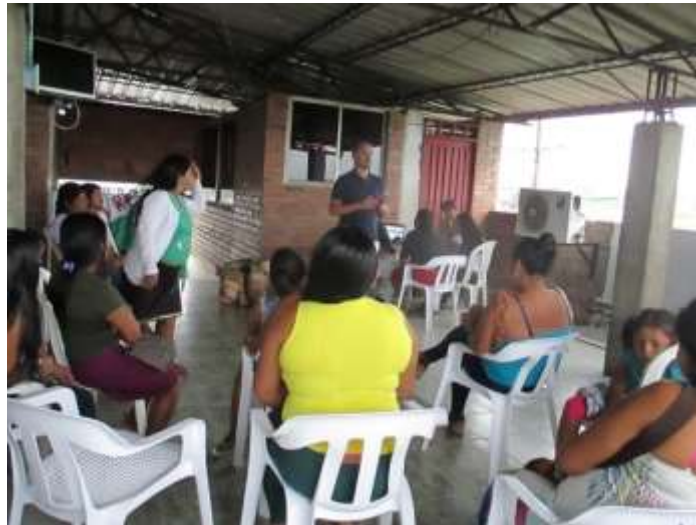
Comunidad Artesanal de Buenaventura, ACIVA en apertura 2018

El grupo de ACIVA 1 está conformado por mujeres que tienen gran interés por fortalecer y rescatar procesos productivos artesanales tradicionales. Otro de sus propósitos es visibilizar la importancia de su rol (como mujeres) dentro de las comunidades indígenas a las que pertenecen y específicamente dentro de la Asociación de Cabildos Indígenas del Valle de Cauca. Esto debido a que tradicionalmente en sus comunidades, los papeles de liderazgo han sido desempeñados principalmente por los hombres. También desean desarrollar una actividad económica que les deje recursos independientes a los de sus parejas. Las mujeres del grupo de ACIVA son conscientes de que esto únicamente es posible a través de su organización y el fortalecimiento del trabajo en red -también de la empatía y el apoyo entre las mismas participantes-.