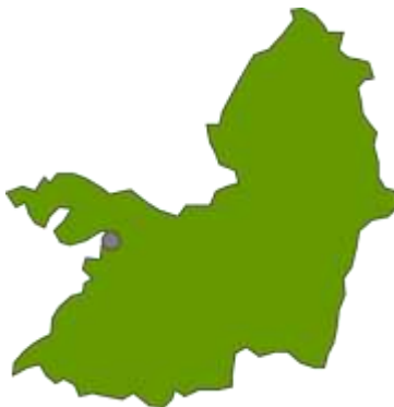
Mapa ubicación geográfica del Municipio de Buenaventura