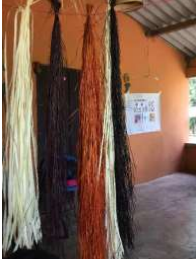
Segmentación de pintas de color