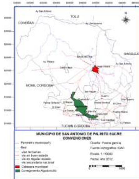
Ilustración 1 Mapa tomado de la página Alcaldía del municipio de San Antonio de Palmito.

El Municipio posee un eje vial que parte desde Montería hasta Tolú viejo. Esta vía se encuentra asfaltada y en un estado regular. Comúnmente, los habitantes de este municipio se transportan por una vía conocida como la Arena que comunica a Sincelejo con San Antonio, dicho tramo cuenta con 800 metros destapados y el resto en buen estado.