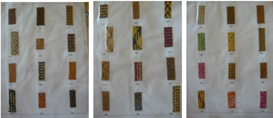
Catálogo en muestras en caña flecha, tejidos y tinturas del material.