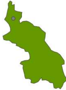
Mapa de la ubicación geográfica del municipio de San Antonio de Palmito