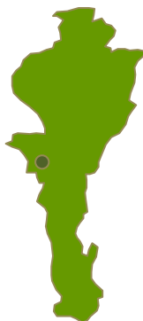
Mapa de la ubicación geográfica del municipio de Chimichagua

En el departamento del Cesar, se ubica el municipio de Chimichagua, lugar donde funge la Asociación de Artesanos de Chimichagua, conocida más popularmente por su sigla ASOARCHI, esta convoca a artesanos de ascendencia NARP, en torno al oficio de la tejeduría en palma.