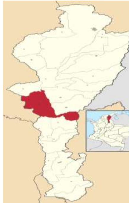
Ilustración 1. Mapa del Dpto del Cesar. Municipio de Chimichagua.

En este municipio la actividad pesquera es el motor de la economía especialmente en la cabecera municipal y el corregimiento de la Candelaria, Saloa, Tamegua. Así como la agricultura y ganadería en algunas zonas del municipio.