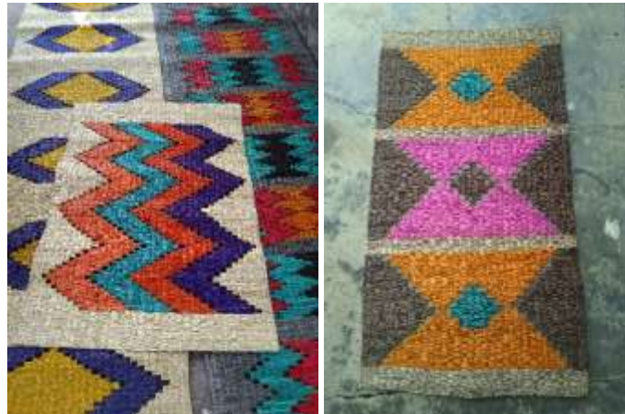
Combinaciones de color de tintes naturales e industriales

Uno de los espacios de transmisión de sus referentes culturales se da con las reuniones periódicas que tiene el grupo, en estos espacios comparte conocimientos en el manejo de la materia prima, tinturados, colores y tonalidades descubiertas con las combinaciones de insumos naturales e industriales, así como las historias que relatan usadas en los diseños de los productos.