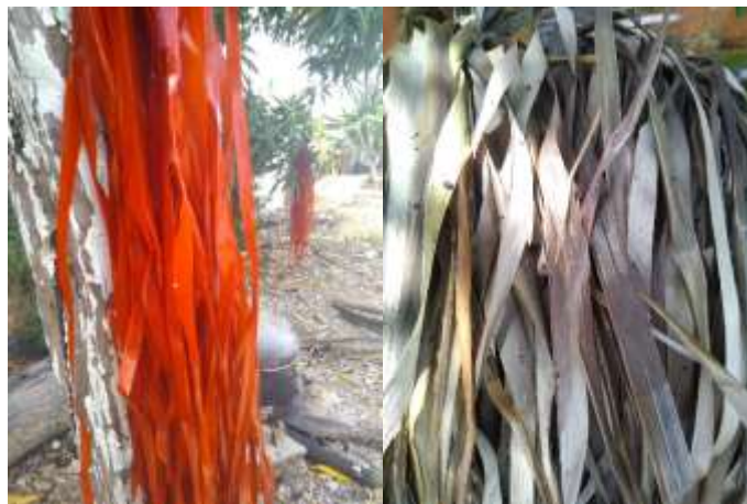
Colores naturales obtenidos con Bija y Jagua

La comunidad trabaja el tejido de palma de estera en telar vertical con diferentes diseños de dibujos representativos de la zona de Chimichagua, así como el uso de tintes naturales de plantas como el achiote, dividivi, jagua, totumo, bija y minerales como el barro con los que logran colores naturales de una paleta de colores terracota y colores neutrales aptos para la elaboración de productos como lo son los caminos de mesa, individuales, pie de cama, abanicos, entre otros.