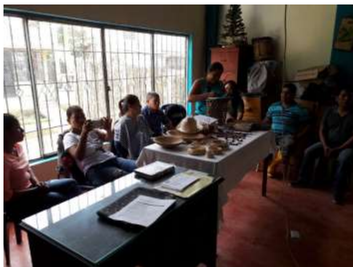
Comunidad Artesanal de Orito en apertura 2018

Foto contratista: Pablo Borchers. Archivo de Artesanías de Colombia 2018