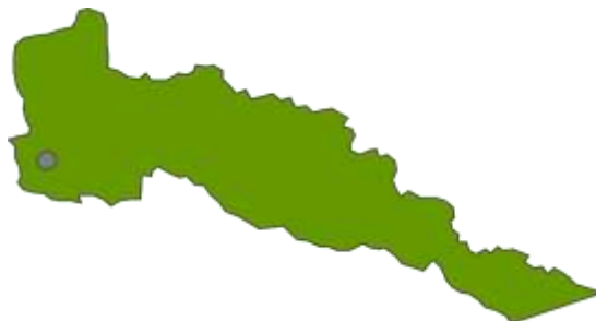
Mapa ubicación geográfica del Municipio de Orito

El Pueblo Indígena Awa del Municipio de Orito es denominado “hombres de la montaña, entre 19 Cabildos parten de una organización Política, con la aplicación de leyes de origen y ley natural como pueblo étnico.” La topografía del municipio va de montañas en los límites con el departamento de Nariño, a las suaves ondulaciones hacia el suroccidente. Esta última es la predominante, aunque presenta terrenos planos en su parte sur. El principal río es el río Orito, que atraviesa el municipio. Pero tiene otros ríos como el Guamuez, el Luzón, el Caldero, san Juan, y el Yarumo, el Acaé, el Quebradón y otras quebradas de menor importancia” (SOREL AROCA, GOBERNADORA PUTUMAYO 2016 -2019)