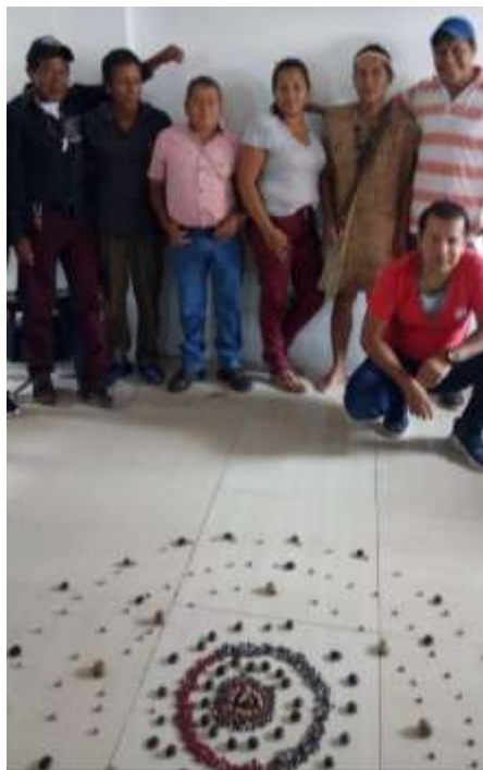
Registro Fotográfico. Líder, artesanos, sabedores AWA

La dinámica cultural en el pueblo Awá es primordialmente promovida por los mayores (hombres y mujeres) quienes en su condición de custodios del conocimiento tradicional heredado y a su vez los puentes para la conexión espiritual de la comunidad, transmiten a las nuevas generaciones saberes propios como los cuidados de la mujer y su conexión en el vínculo con la madre tierra y su mundo o el “Katza- su” más sus cuatro mundos a los que consideran la vida del indígena AWA donde converge la cosmovisión y los sistemas propios de manera integral, su rol de sabedores, médicos tradicionales, guías espirituales y orientadores permiten que como pilares culturales trasciendan en su identidad tanto en su Pueblo Indígena como en la identidad de todo su territorio.