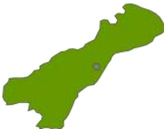
Ilustración 1. Mapa de la ubicación geográfica del municipio de Maicao

En la península de la Guajira, hacia el noreste de Colombia y sobre las riveras del mar caribe se encuentra ubicado el Departamento que recibe el mismo nombre. Conformado por 15 municipios, 48 corregimientos y 142 centros poblados entre corregimientos, inspecciones de policía y caseríos. Con una extensión de 20.848 km 2 , que representan el 1.8 % del territorio nacional. Está situado en el extremo norte del país y en la llanura del Caribe, en la parte más septentrional de América del Sur. Limita por el norte con el mar Caribe, por el oriente con el mar Caribe y la República de Venezuela, por el sur con el departamento del Cesar y por el occidente con el departamento del Magdalena y el mar Caribe.