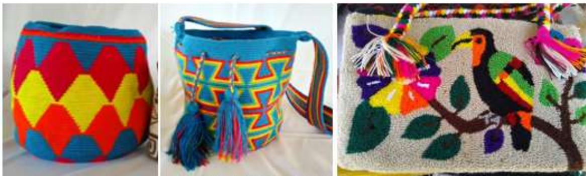
Artesanías de la comunidad La Estrella.

El oficio de tejer es una actividad que se hereda de sus ancestros, el tejido y la calidad de ello se demuestra el compromiso de crecer como etnia, las artesanías wayuu caracterizadas por sus colores, diseños y complejidad de técnicas las cuales simbolizan elementos representativos en la naturaleza como animales, plantas, rostros, etc... los cuales obligan al artesano a realizar mochilas de alta complejidad en donde la pieza adquiere más valor, en el caso de la Ranchería La Estrella los elementos representativos escasean debido al valor tan bajo que se les a sus productos en la zona, es un tema de importancia para realizar las implementaciones, su identidad debe ser reflejada en todos los productos.