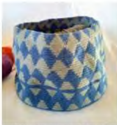
Mala estructura del tejido

Calidad de los tejidos: La calidad de los tejidos cada día va desmejorando, debido a la competencia en el departamento por la gran demanda de mochilas, el precio del producto cada día es más bajo, por esto la comunidad deja de exigirse para lograr calidad y distinción, La estrella está en un nivel bajo en cuanto a estándares de calidad, malos pegues de gasas, hilos sueltos, mochilas sin estructura, es de importancia realizar mejoramiento en este sentido. Adicionalmente, debido a los precios bajos, eligen eliminar el manejo de iconografía tradicional como los Kannas o las flores, ya que una mayor complejidad del diseño implica mayores tiempos de tejido.