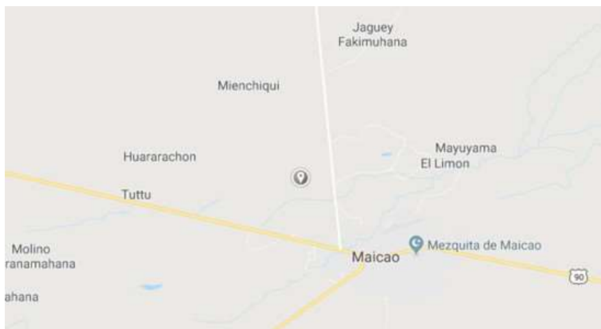
Ilustración 2. Ubicación geográfica de la Rancharía La Estrella.

La ranchería la Estrella se encuentra ubicada a media hora vía Maicao- Riohacha, esta ranchería hace parte de los límites con Maicao, actualmente no se encuentra localizada en mapas de Colombia.,