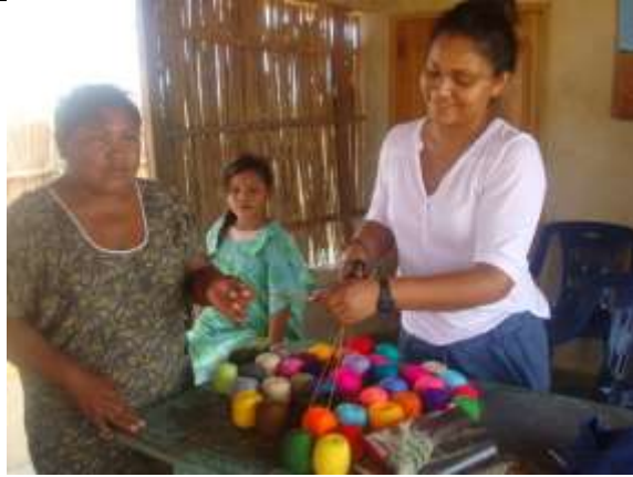
La última fase de la actividad consistió en realizar combinaciones de colores basadas en los referentes.