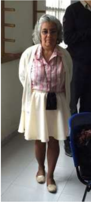
Falda Rotonda Colegio Policarpa Salavarrieta. 27.08.2015 Artesanías de Colombia