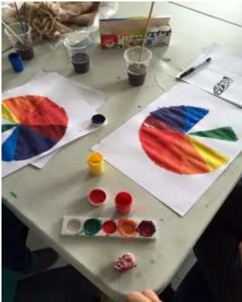
Círculo Cromático Colegio Policarpa Salavarrieta. 20.08.2015 Artesanías de Colombia