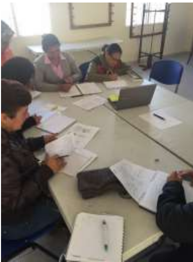
Desarrollo de Colecciones Colegio Policarpa Salavarrieta . Fotógrafo Juan Pablo Martínez 17 de septiembre de 2015 Artesanías de Colombia