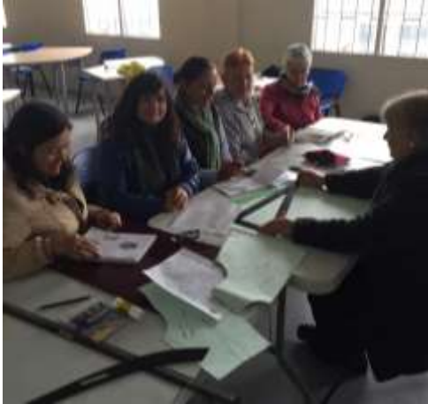
Corpiño Colegio Policarpa Salavarrieta . 8 de octubre de 2015 Artesanías de Colombia