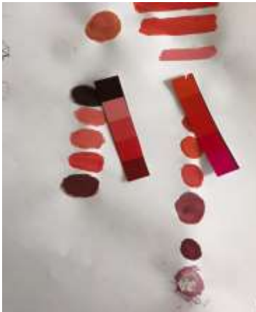
Paleta de Colores Círculo Cromático Colegio Policarpa Salavarrieta. 03.09.2015 Artesanías de Colombia