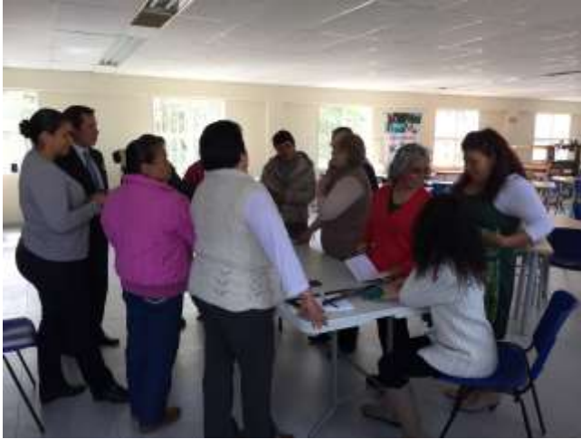
Elongaciones y recuperación. Tejido de punto. Colegio Policarpa Salavarrieta . 3 de septiembre de 2015 Artesanías de Colombia