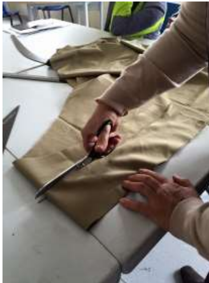
Patronaje y Corte Colegio Policarpa Salavarrieta.