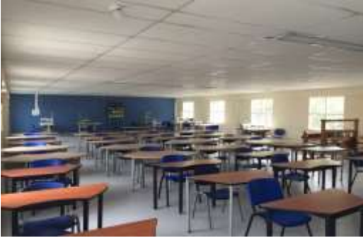
Colegio Policarpa Salavarrieta