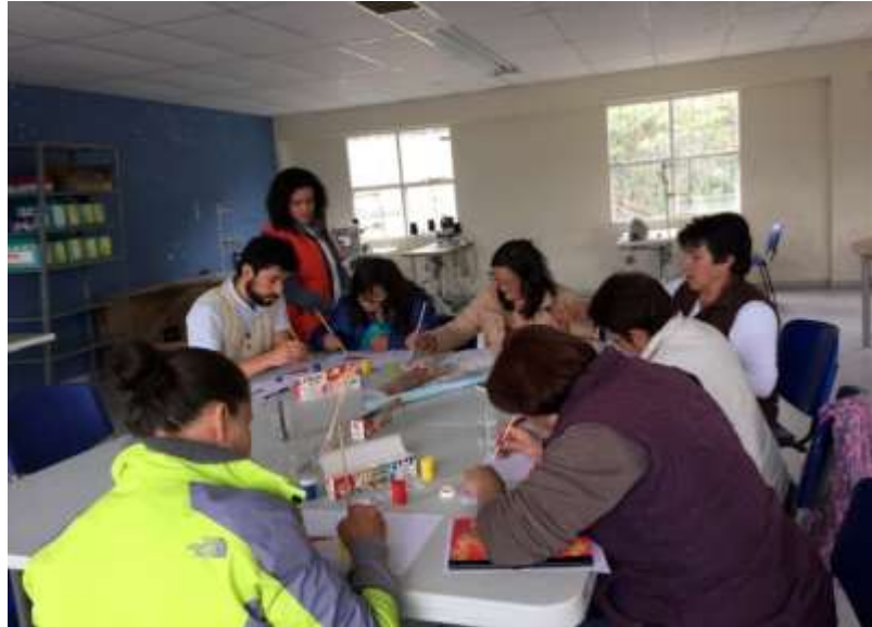
Teoría del Color Colegio Policarpa Salavarrieta. 20.08.2015 Artesanías de Colombia