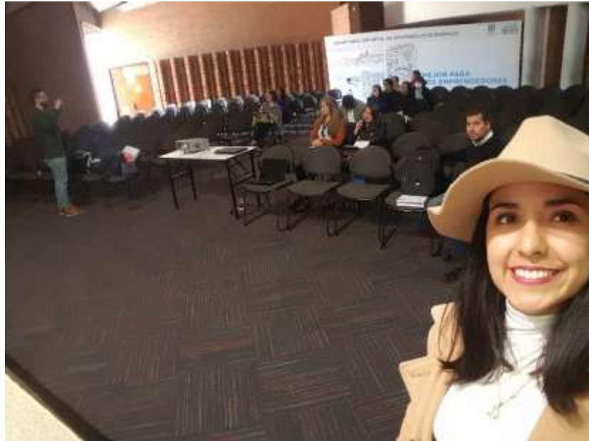
Taller seguridad industrial Fecha: 22 de noviembre de 2017 Lugar: Plaza de artesanos