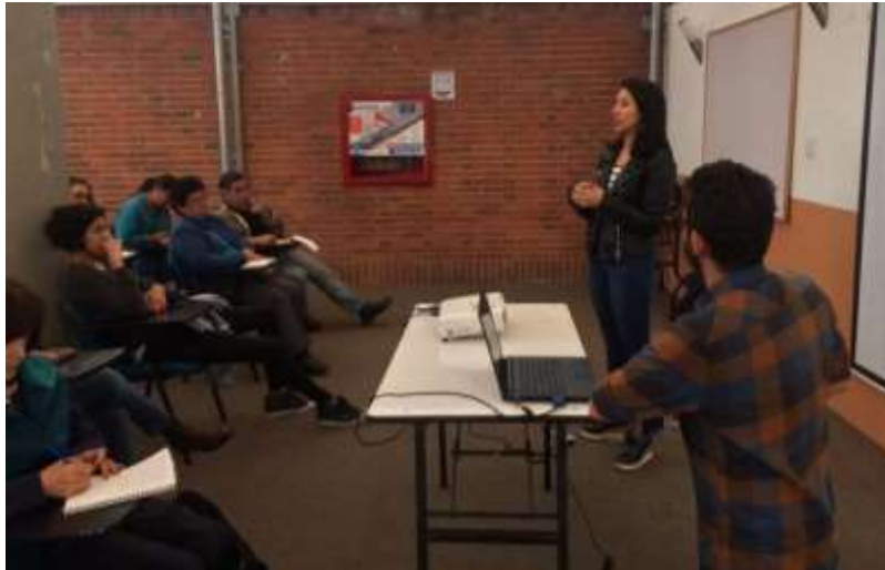
Presentación tendencias 2017-2018