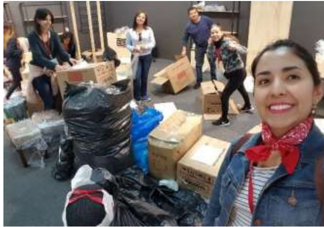
Montaje Expoartesanías 2017 Fecha: 05 de diciembre de 2017 Lugar: corferias