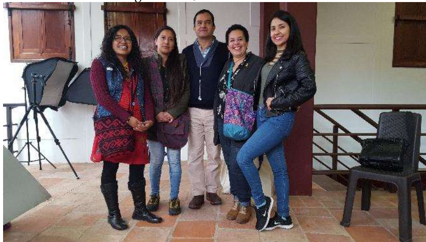
Entrega productos Expoartesanías Fecha: 14 de noviembre de 2017 Lugar: Artesanías de Colombia – Sede Aguas