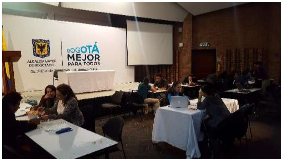
Convocatoria evaluación unidad productiva Fecha: 14 de Septiembre de 2017 Lugar: Plaza de los artesanos