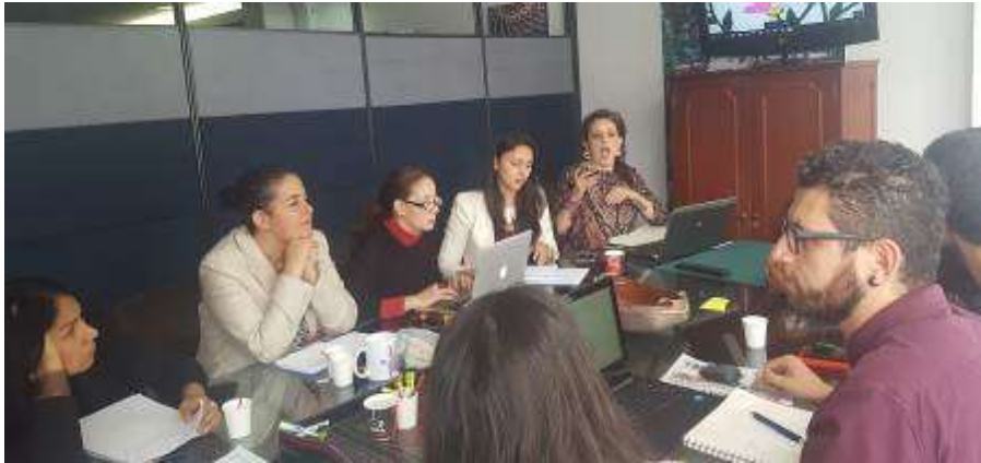
Reunión de evaluación y clasificación de los artesanos Fecha: 12 de Septiembre de 2017 Lugar: Oficinas Artesanías de Colombia