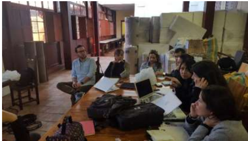
Reunión logística Expoartesanías 2017 Fecha: 28 de noviembre de 2017 Lugar: Artesanías de Colombia – Sede Aguas