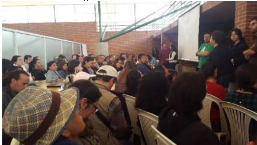
Presentación tendencias 2017-2018