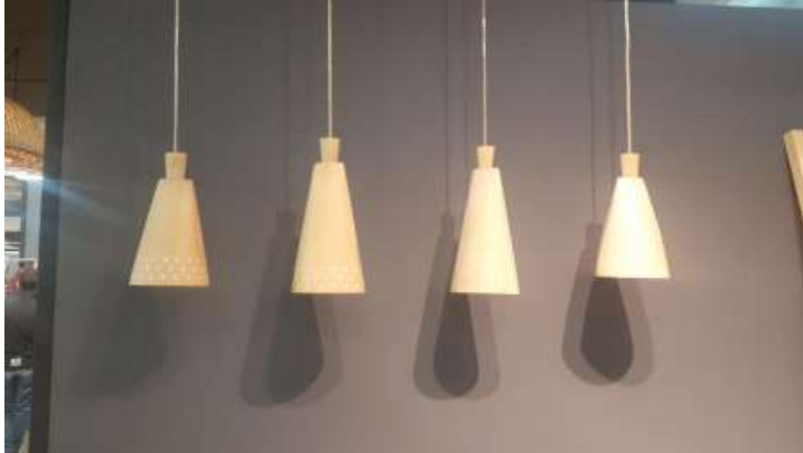
Exhibición productos Expoartesánías 2017 Fecha: 09 de diciembre de 2017 Lugar: corferias