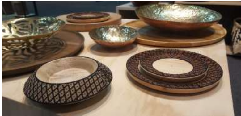
Exhibición productos Expoartesánías 2017 Fecha: 08 de diciembre de 2017 Lugar: corferias