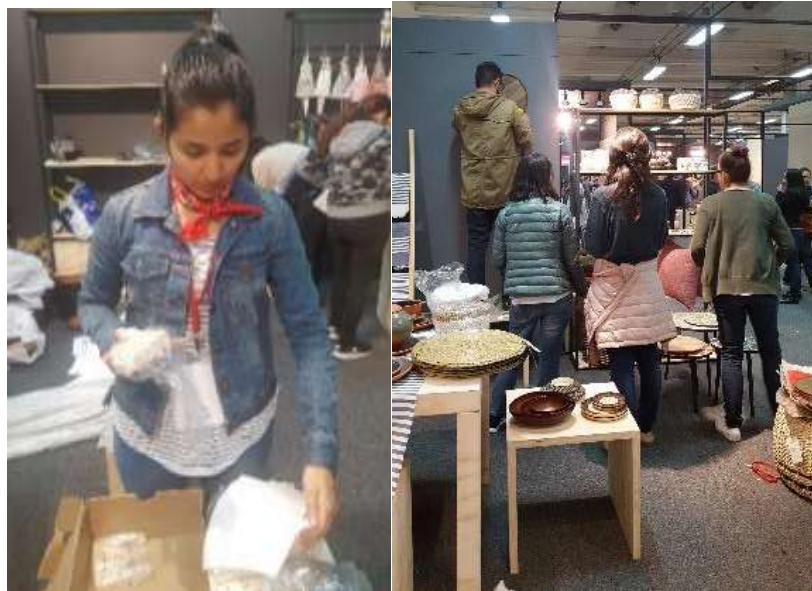
Montaje Expoartesanías 2017 Fecha: 05 de diciembre de 2017 Lugar: corferias