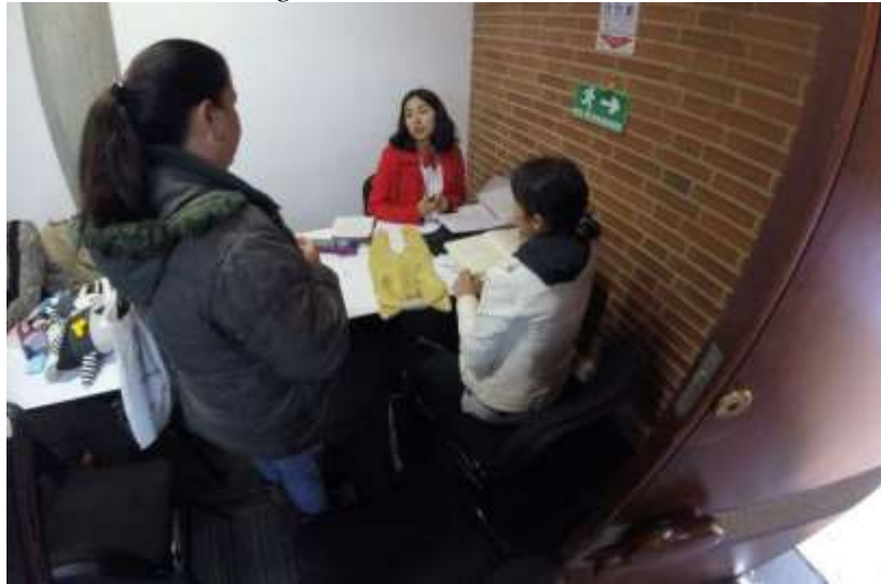
Convocatoria evaluación unidad productiva Fecha: 12 de octubre de 2017 Lugar: Plaza de los artesanos