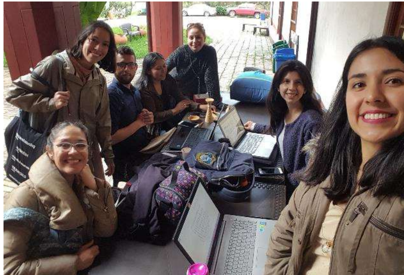
Montaje productos stand proyecto Bogotá Fecha: 20 de noviembre de 2017 Lugar: Artesanías de Colombia – Sede Aguas