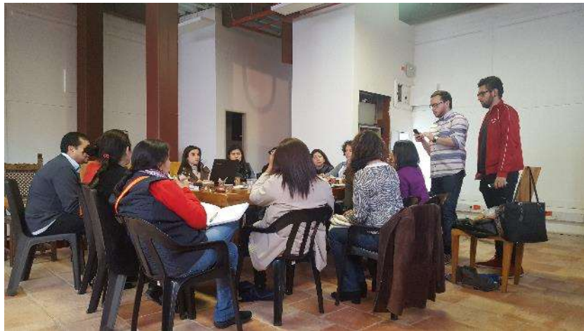
Reunión equipo de diseño Fecha: 03 de noviembre de 2017 Lugar: Artesanías de Colombia – Sede Aguas