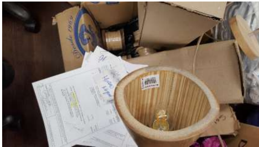
Etiquetado productos LabBogotá Fecha: 20 de noviembre de 2017 Lugar: Artesanías de Colombia – Sede Aguas