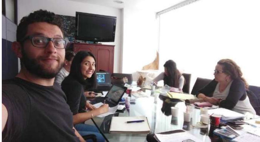
Reunión de evaluación y clasificación de los artesanos