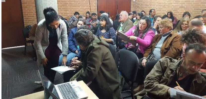
Taller/charla creatividad Fecha: 08 de noviembre de 2017 Lugar: Plaza de los artesanos