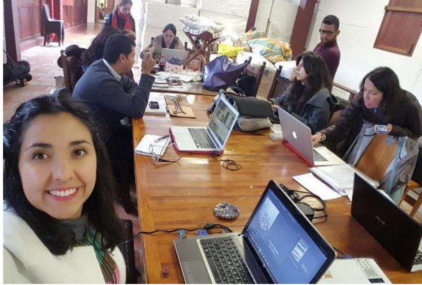
Comité selección productos stand proyecto Bogotá Fecha: 17 de noviembre de 2017 Lugar: Artesanías de Colombia – Sede Aguas