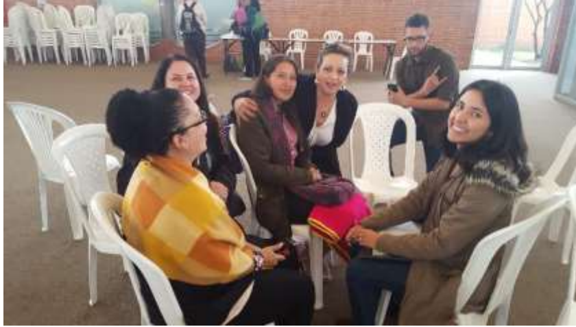
Asesorías Unidad productiva Fecha: 20 de Septiembre de 2017 Lugar: Plaza de los artesanos