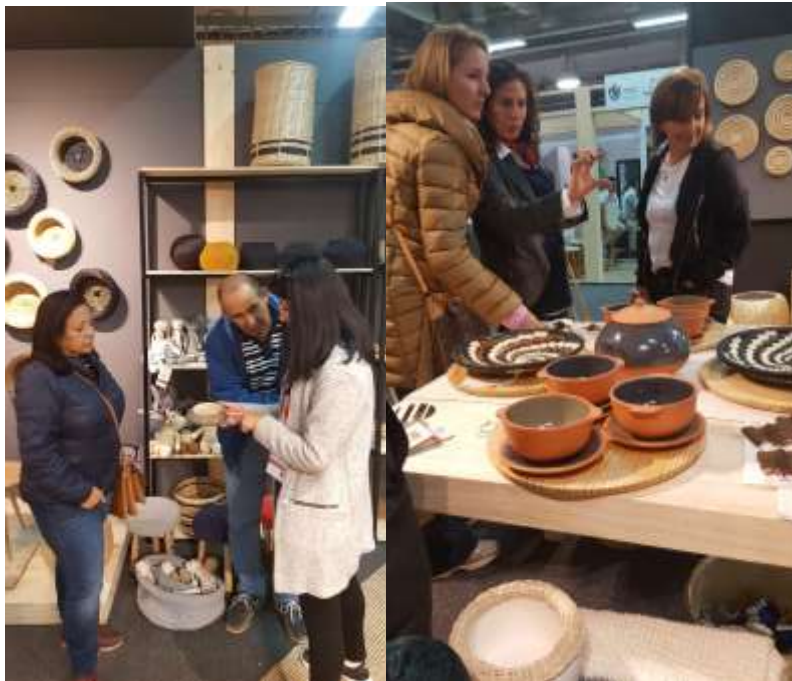
Asesorías visitantes Expoartesánías 2017 Fecha: 08 de diciembre de 2017 Lugar: corferias