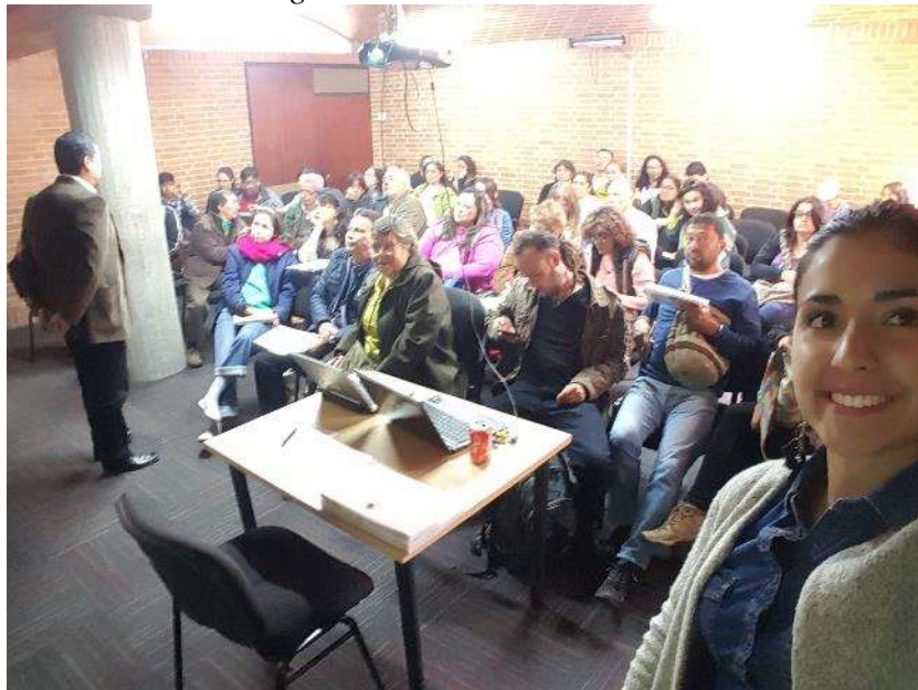
Taller/charla creatividad Fecha: 08 de noviembre de 2017 Lugar: Plaza de los artesanos