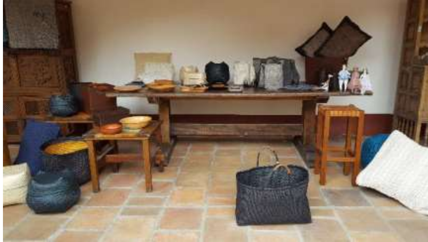
Montaje productos stand proyecto Bogotá Fecha: 20 de noviembre de 2017 Lugar: Artesanías de Colombia – Sede Aguas