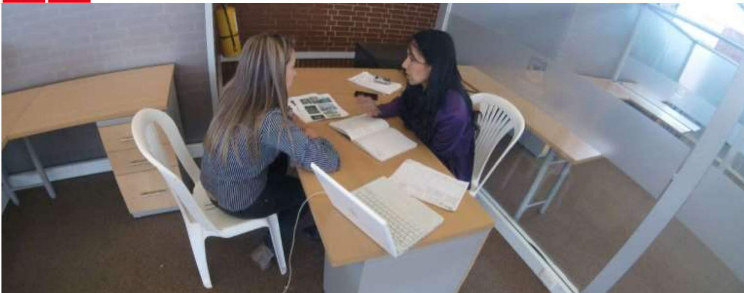
Reuniones de Asesores