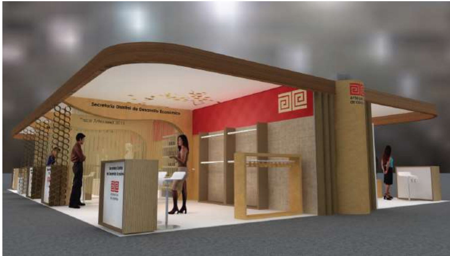
Pabellón 6 Mesa y Decoración