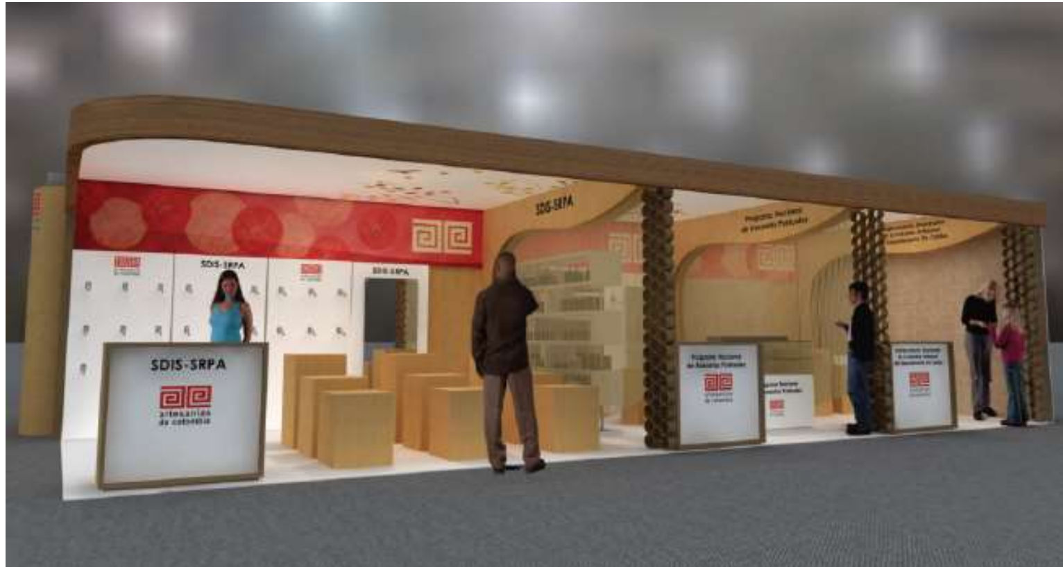
Pabellón 6 Mesa y Decoración