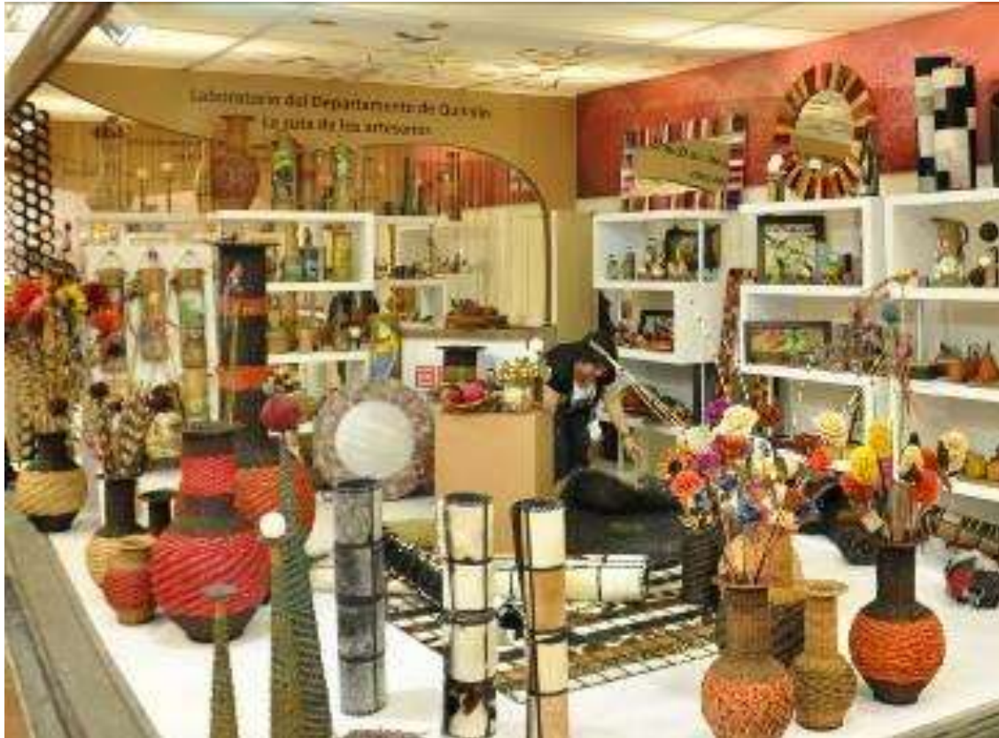
Pabellón 6 Mesa y Decoración