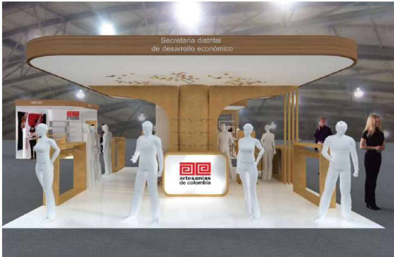
Pabellón 8 Moda y jugueteria