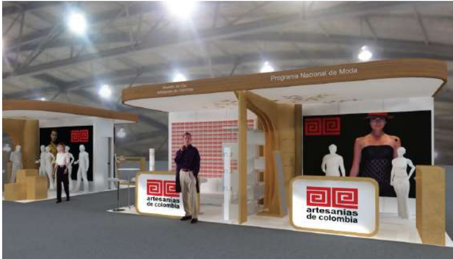
Pabellón 8 Moda y jugueteria