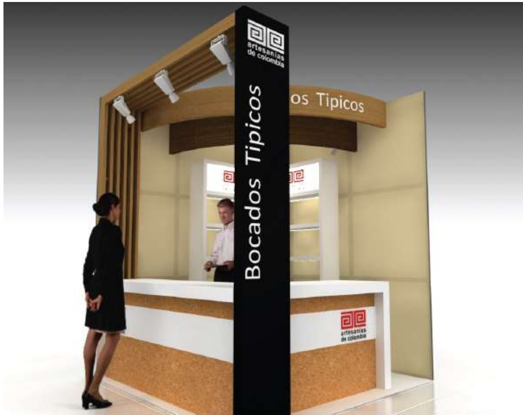
Pabellón 5 Bocados típicos