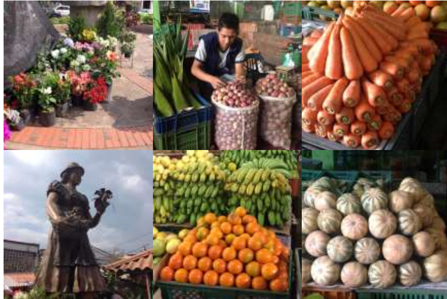
Visita Fusagasugá, Plaza de mercado, Municipio de Fusagasugá- Cundinamarca, Septiembre 1 de 2015, Gabriela Oliva. Artesanías de Colombia.