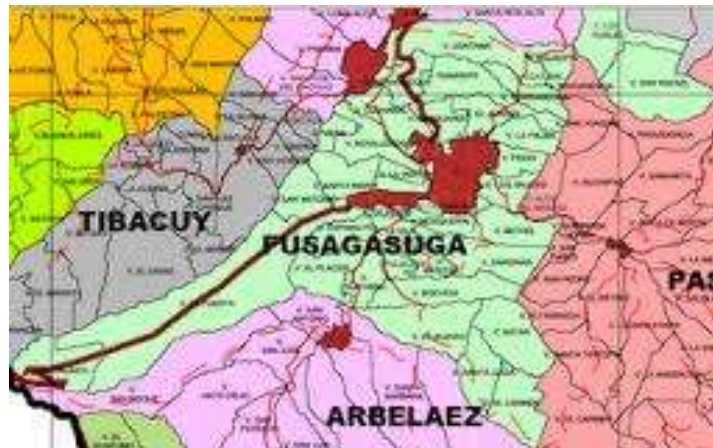
Municipio de Fusagasugá- Departamento de Cundinamarca.