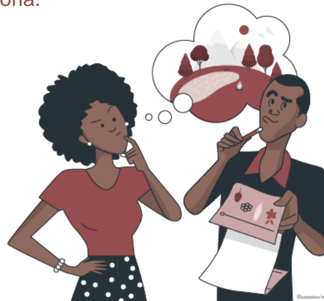
Illustration by Stories by Pongak

Puede ser sobre un mito o una historia tradicional, el entorno en el que viven y su naturaleza, algo de su cotidianidad o algún elemento de sus prácticas rituales y espirituales, si así lo desean.