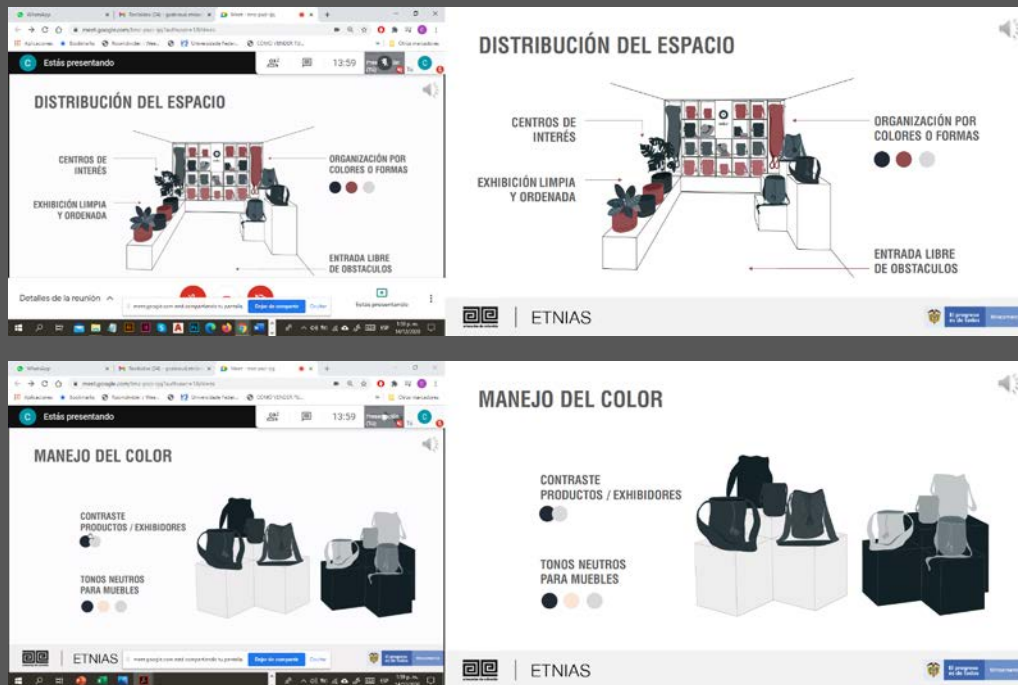
Descripción y lugar: Taller grupo artesanal Mites

Formato digital en el que se envía: Video en MP4