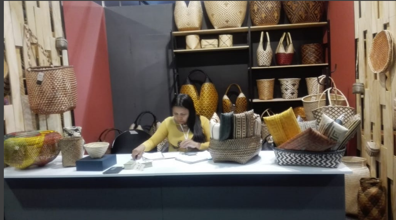
Descripción y lugar :Expoartesanías 2019

Nombre Comercial: MITES Número de artesanos: 15 artesanos Asesor Comercial: Camila Abreu