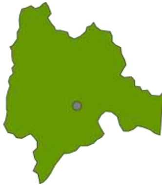
Mapa de ubicación de la ciudad de Bogotá. D.C

El pueblo indígena Eperara Siapidara es una comunidad ubicada en el departamento del Cauca (en la ribera del río Saija), Valle del Cauca (en el río Naya) y Nariño (en los municipios de El Charco y Olaya Herrera). También existen algunos integrantes que han sido desplazados por la violencia y viven en Bogotá desde el año 2008.