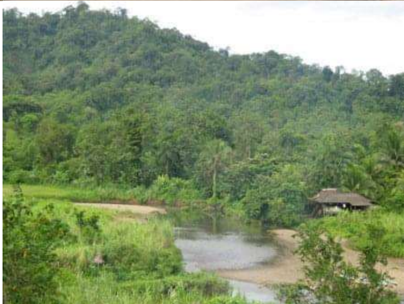
Casas de los familiares de las artesanas, en el Resguardo de Guanguí.

Otro de los elementos contrastados fueron los animales. En el resguardo hay todo tipo de animales con los cuales convive la comunidad: osos, monos, águilas, arañas, peces, tigres, todos ellos tejidos en los canastos. En la ciudad, las artesanas solo ven palomas y perros. Por último, el contraste de la comida y su adquisición, alimentos como la papachina no se encuentran en Bogotá. Allá cultivan maíz, frijol,