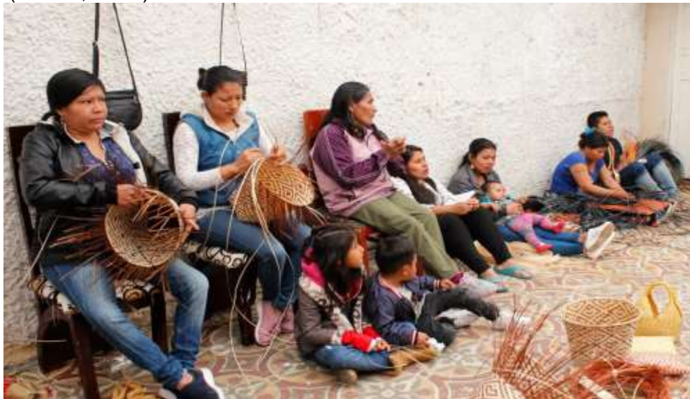
Imagen: abuela Eperara, mujeres y niños del grupo artesanal Mités tejiendo en grupo y compartiendo saberes sobre la cestería.