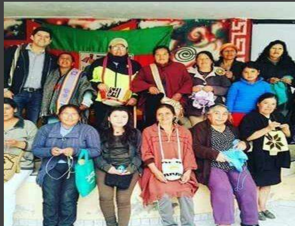
Artesanas del grupo artesanal Mutecypa