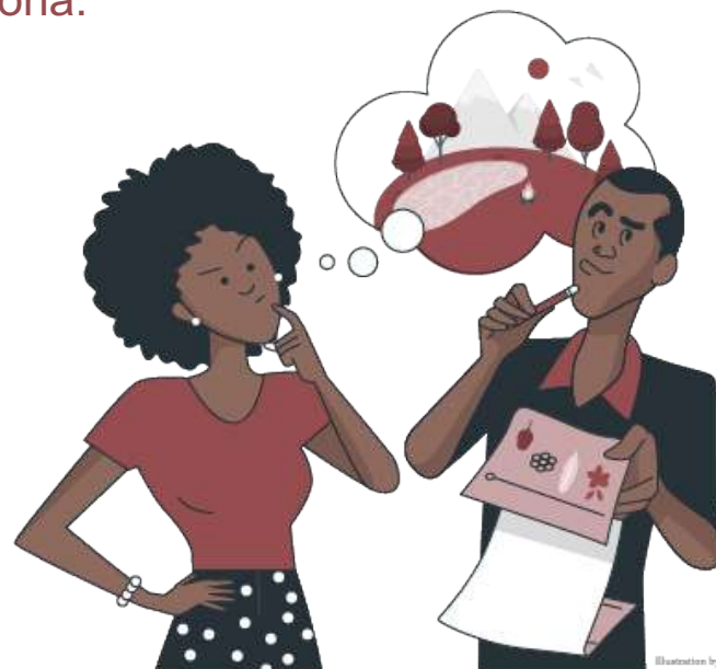
Illustration by Shireen by Pongle

Puede ser sobre un mito o una historia tradicional, el entorno en el que viven y su naturaleza, algo de su cotidianidad o algún elemento de sus prácticas rituales y espirituales, si así lo desean.