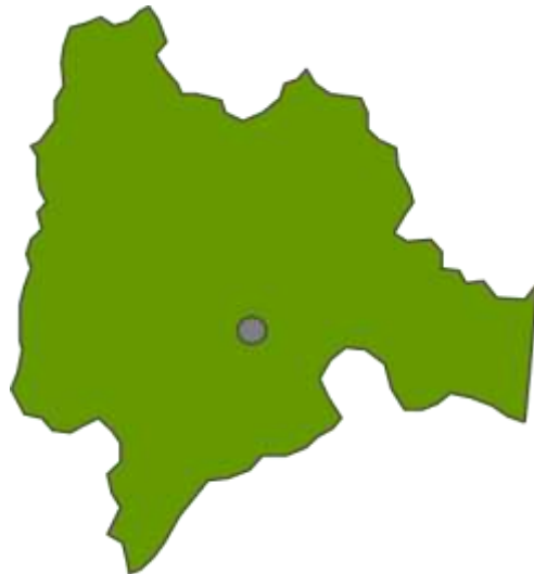
Mapa de ubicación de la ciudad de Bogotá. D.C