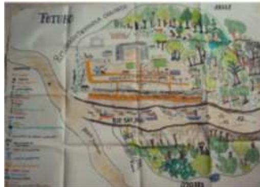
Imágenes: dibujos del pueblo Wounaan de su territorio en el pasado, en el presente y en el futuro. Tomado del Plan de Salvaguarda del Pueblo Wounaan, pg 14 y 15, 2012. (Ministerio del Interior, 2012)

El territorio donde viven los Wounaan (del sur del Chocó) se considera que está dividido en dos grandes regiones: