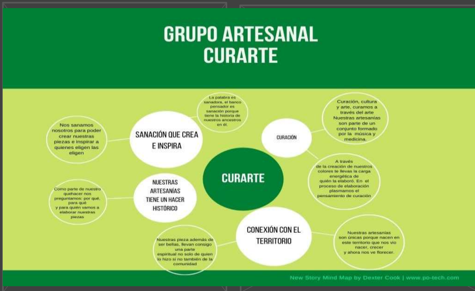
Diagrama de apoyo para la realización de la campaña “No hay otra igual”

El artesano se comprometió a trabajar con el equipo de comunicación a trabajar en la elaboración del video a partir de el trabajo realizado en el taller. El diagrama a continuación se elaboró a partir del testimonio y sirvió de apoyo para la grabación del video.