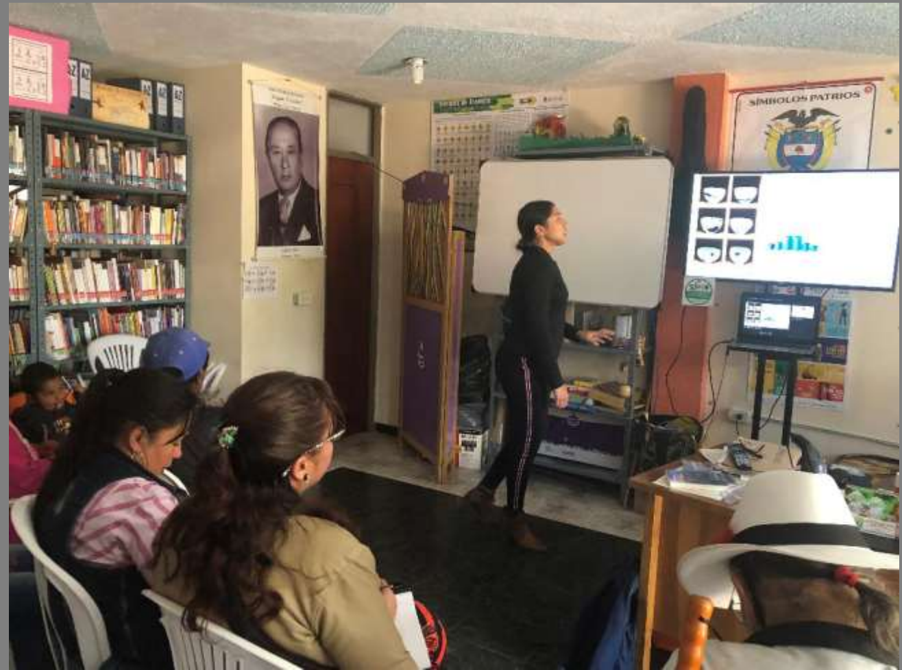
TALLER DE VITRINISMO Y MERCADEO