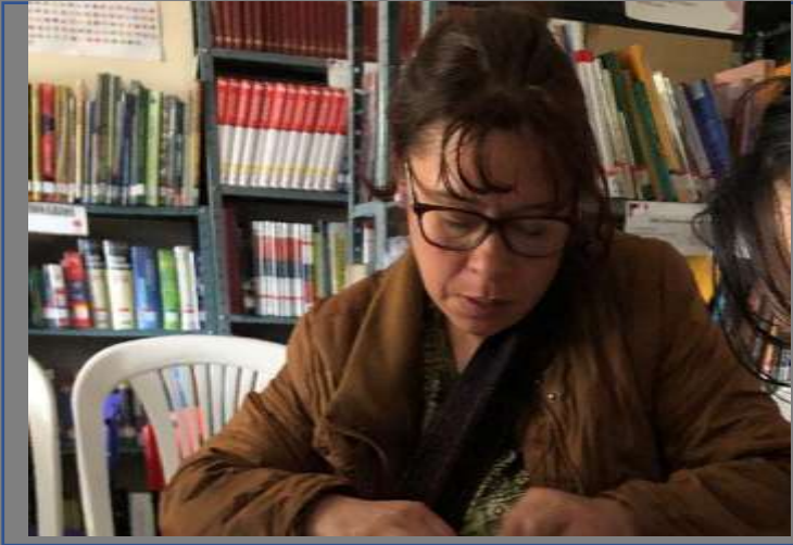
FOTO DEL ARTESANO