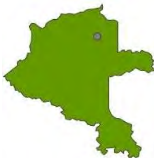
Mapa de ubicación geográfica del municipio de Mitú

El departamento del Vaupés consta con una división administrativa correspondiente a 3 municipios; Mitú su capital, Carurú y Taraira, es uno de los 6 departamentos amazónicos colombianos, limita al norte con Guainía y Guaviare, al sur oeste con Caquetá, al sur con el Amazonas y al este con Brasil.