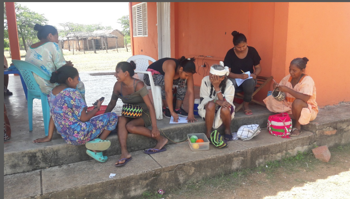
Comunidad de Iparu, Barracas, La Guajira. Agosto de 2019. Taller de Implementación.