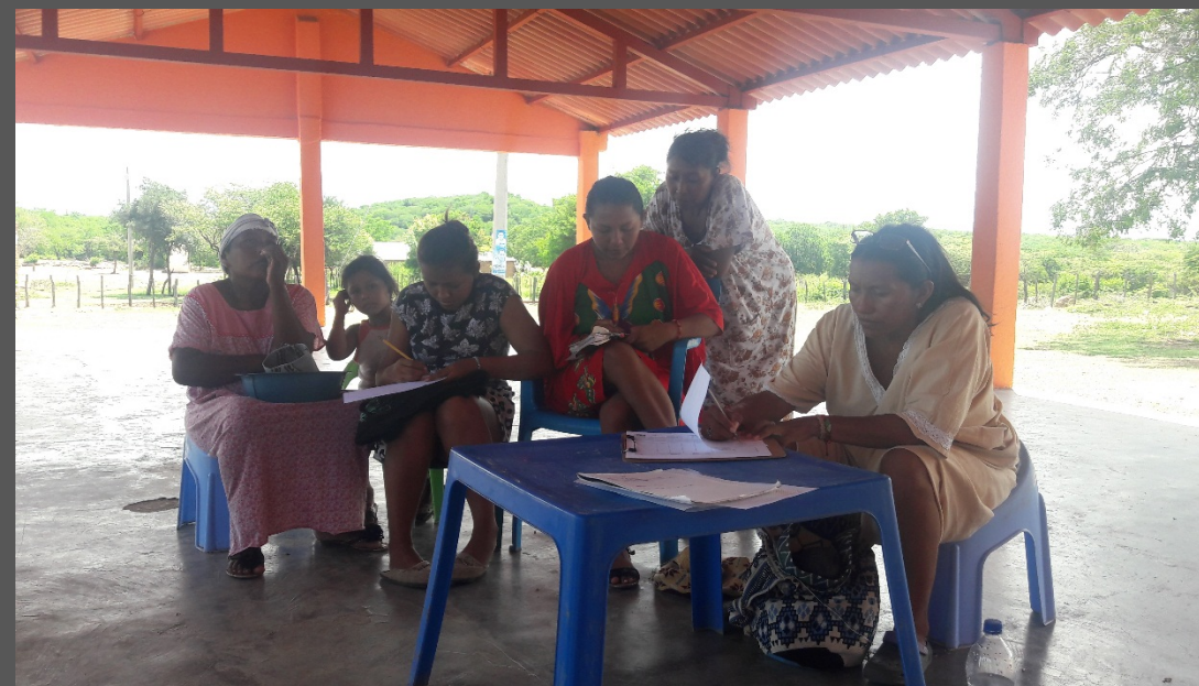
Comunidad de Iparu, Barracas, La Guajira. Agosto de 2019. Taller de Implementación.