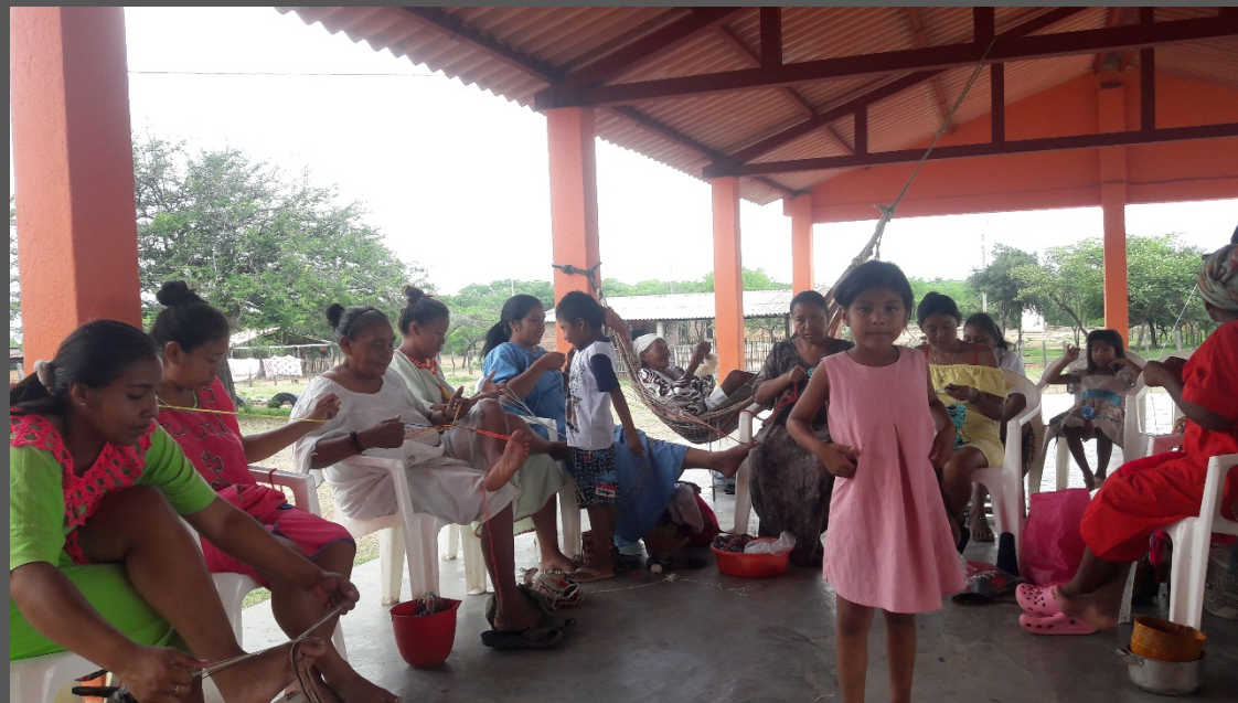
Comunidad de Iparu, Barracas, La Guajira. Octubre de 2019. Taller de Implementación.