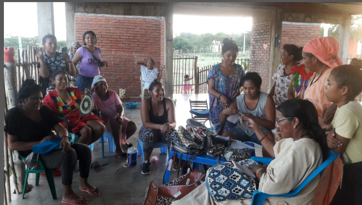
Comunidad de Wayuu Iparu, Barrancas, La Guajira. Octubre de 2019. Taller de Implementación.

Plan de inversión del rubro de Transmisión de saberes.