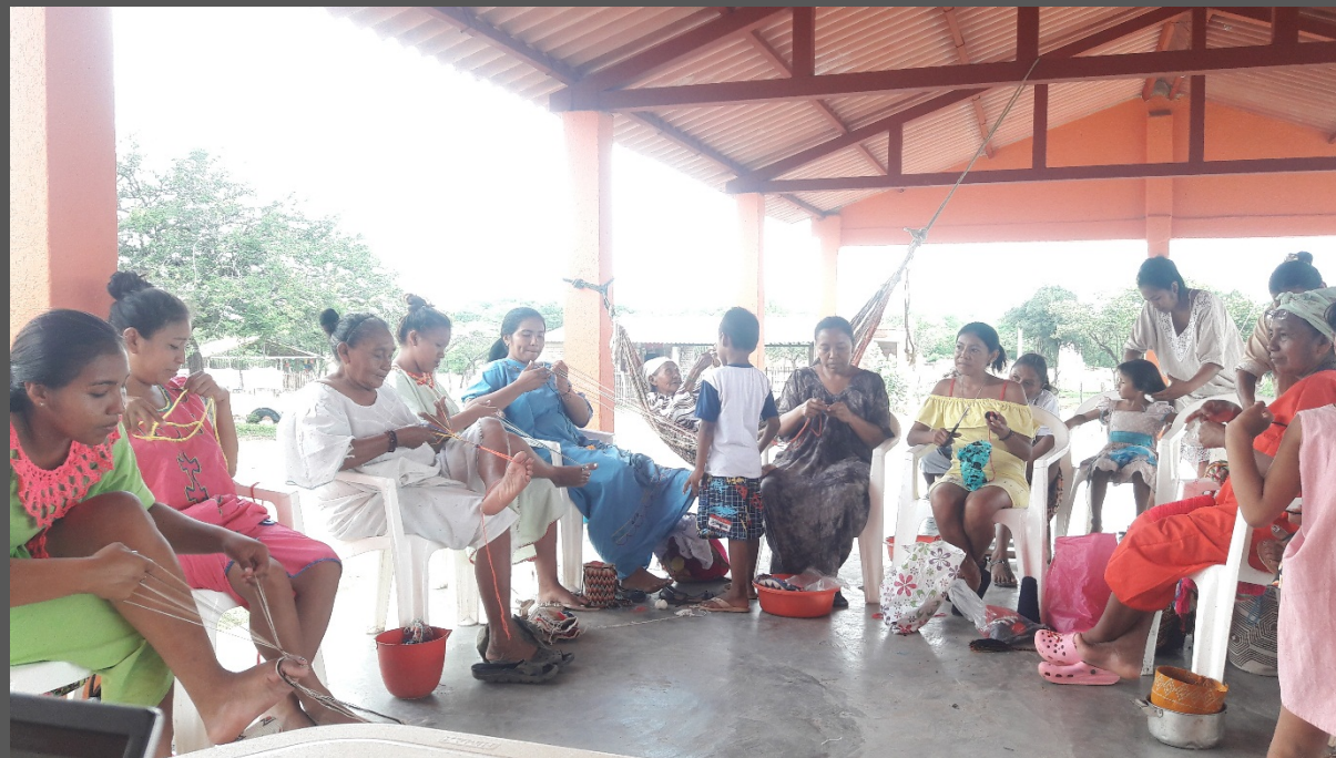
Comunidad de Iparu, Barracas, La Guajira. Octubre de 2019. Taller de Implementación.

Se crearon pequeños grupos de habilidades para que se puedan apoyar en temas como negociación, tecnología, técnicas artesanales y liderazgo.