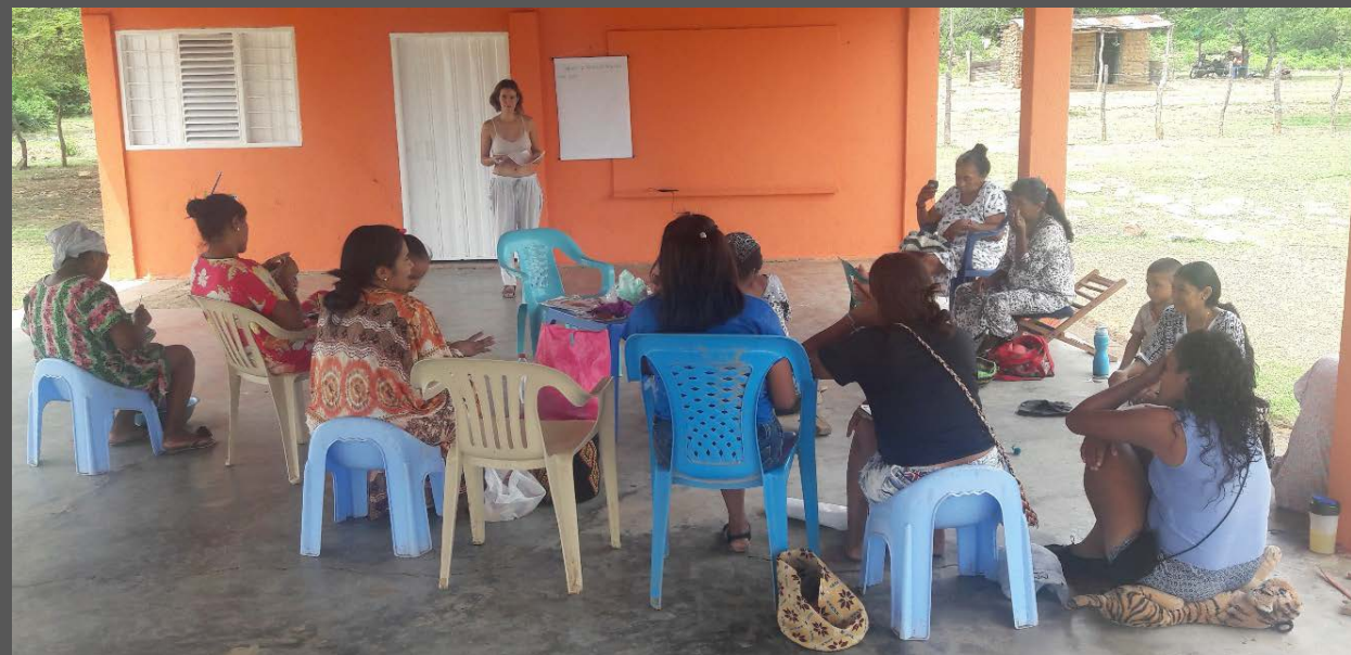
Foto tomada por: Deyaneth Ipuana Comunidad de Iparu, Barracas, La Guajira. Octubre de 2019. Taller de Implementación.