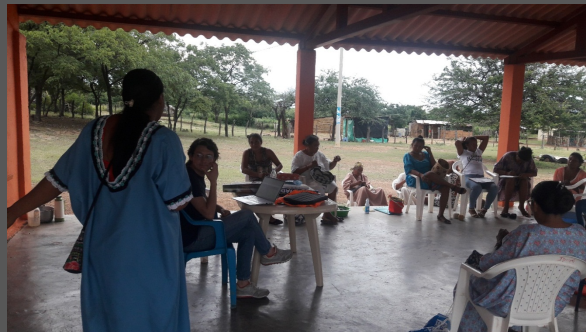
Comunidad de Iparu, Barracas, La Guajira. Octubre de 2019. Taller de Implementación.