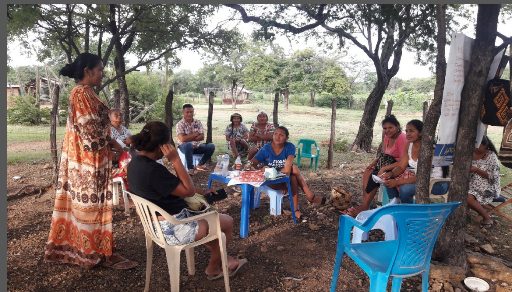
Comunidad de Wayuu Iparu, Barrancas, La Guajira. Octubre de 2019. Taller de Implementación.