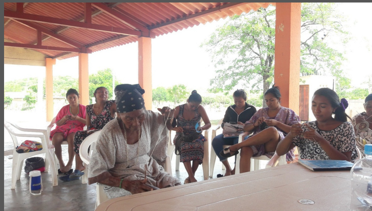
Comunidad de Iparu, Barracas, La Guajira. Agosto de 2019. Taller de Implementación.