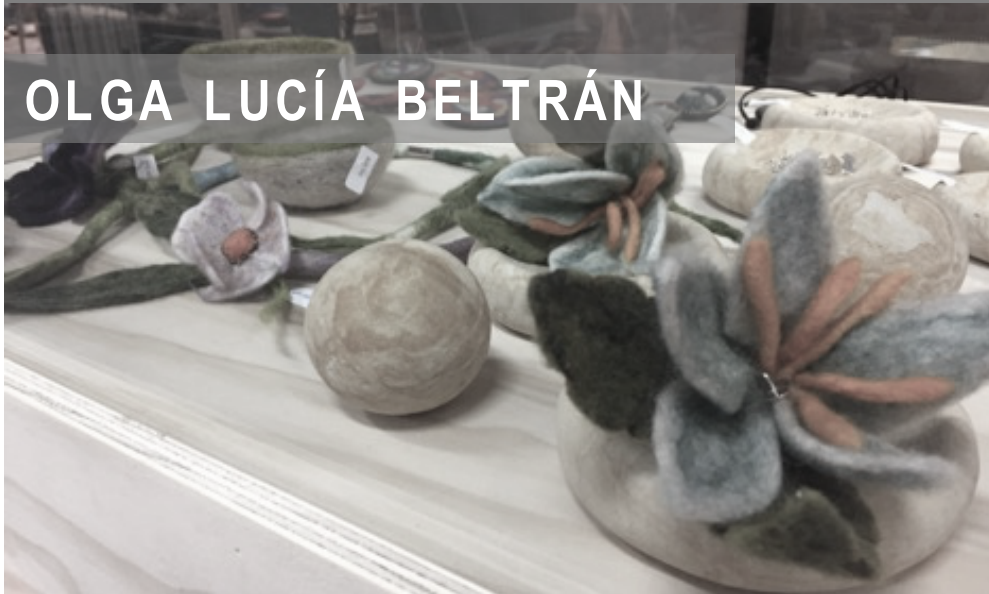
OLGA LUCÍA BELTRÁN