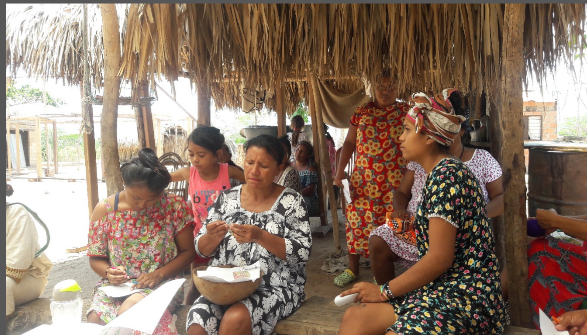
Descripción y lugar: Santa Rosa, Maicao, La Guajira