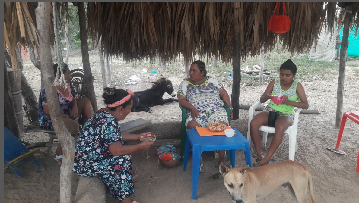
Descripción y lugar: Santa Rosa, Maicao, La Guajira