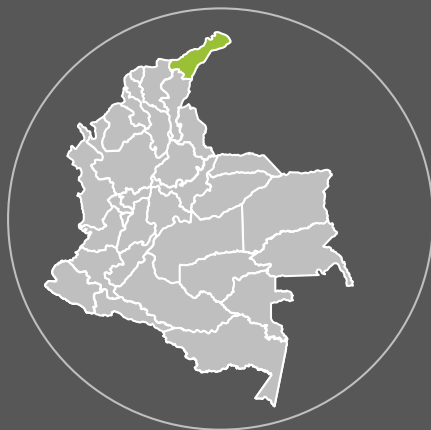
Santa Rosa, Maicao, La Guajira