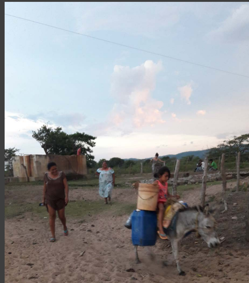
Descripción y lugar: Santa Rosa, Maicao, La Guajira