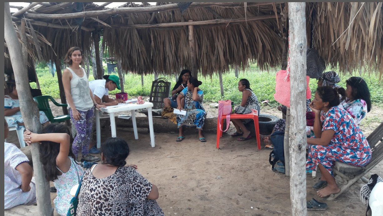
Descripción y lugar: Santa Rosa, Maicao, La Guajira