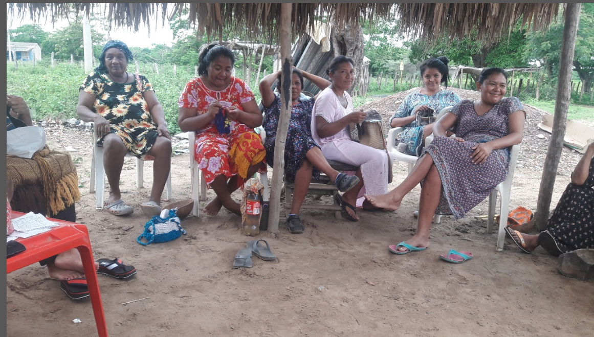
Descripción y lugar: Santa Rosa, Maicao, La Guajira